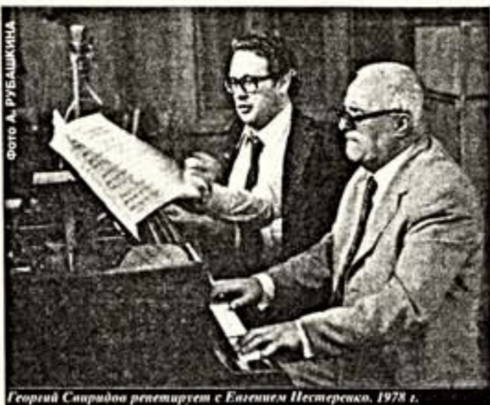
Георгий Свиридов читает с Евгением Нестеренко, 1978 г.

С этими двумя русскими гигантами Свиридов уже не расстается. И вот что нужно отметить: язык его становится богаче, утонченнее. Но нигде не меняется, не перестраивается, не поддается никаким влияниям, как некогда была его эстетическая и этическая позиция. Разрабатывает мир Свиридова. Уникальны по своему достоинству, остро переживаемые. Вокальные произведения — романсы, песни — это галерея портретов, сонных, зримых, жаровые сценки, размышления и исповеди. Хоры в кантатно-ораториальных произведениях — живые картины народной жизни. Они средоточие стихии Мусоргского. Свиридов активно участвует и в общественной жизни как член различных комитетов, обществ, в жюри конкурсов. Он много делает для развития нашей культуры. Некоторые время Свиридов был первым секретарем Союза композиторов РСФСР, деятельность которого он старался возвысить, довести до уровня сочувствующих талантов, но всегда значительных, но често занимающихся своим делом и не забывающих о делах больших. Одну из важнейших задач союзу в тот период он видел в осуществлении грандиозного плана — выпуска многотомного Свода русских народных песен. Это не получилось тогда, и до сих пор сделаны и застыли лишь первые робкие шаги. А дело — великой важности. На этом посту Свиридов пролежал всего несколько лет, и, может быть, и неплохо, что он не был брошен надолго в гущу нашей хорошо организованной в ту пору композиторской жизни. Человек вынужденной высоты лучше видит на расстоянии — панорамно. Слух его должен