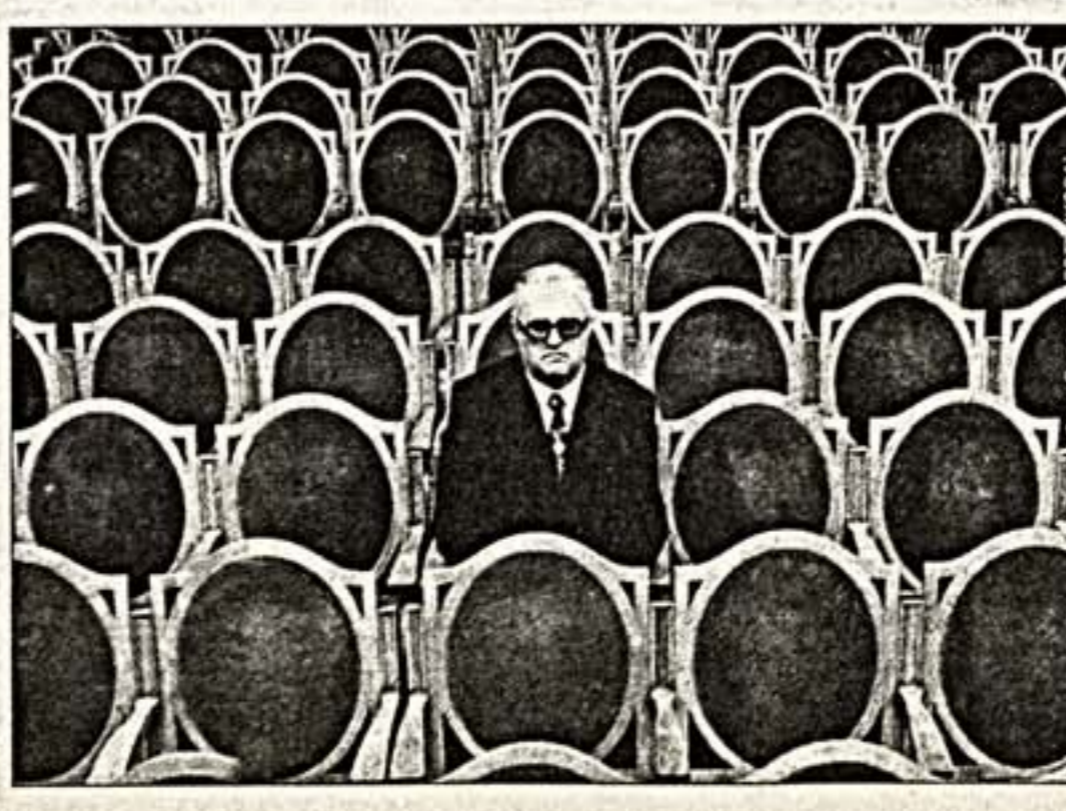
Георгий Васильевич Свиридов

Композитор совершенно свободен в своем творчестве. Только не свободен от музыки и от совести. Он ни к кому и ни к чему не приспосабливается, никому не стремится удивить оригинальностью. То, чем делится он со слушателями, — насущная потребность музыканта. Истинно русский художник, Свиридов, подобно нашим отечественным классикам, "обращается" за средствами выразительности к природе, к жизни. Огромная мудрость и дальновидность Георгия Васильевича делают его музыку живой и вселяют уверенность, что и на будущее времена живое дыхание его мелодий, гармоний, его образное видение жизни народа сохранит это ощущение для следующих поколений.