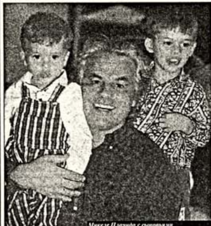
Микеле Плачидо с сыновьями