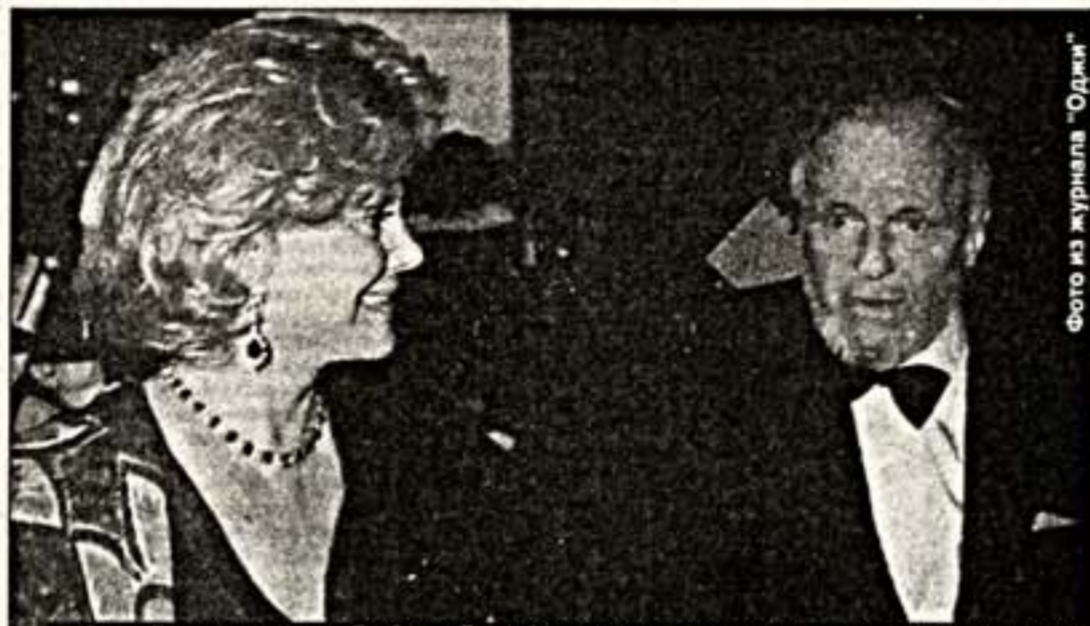
Франк Синатра и его жена Барбара в Лос-Анджелесе на открытии сезона в местном оперном театре