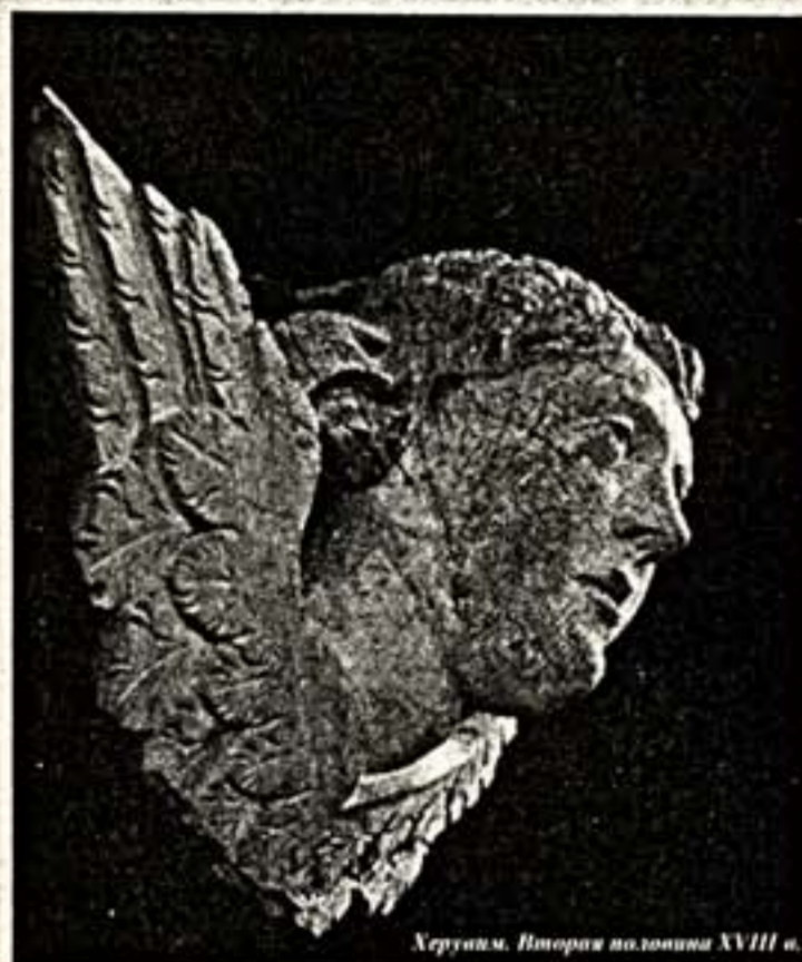
Хрустик. Вторая половина XVIII в.