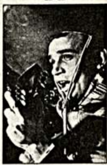
Евгений Урбанского помянули теплым словом все наши зрители. Все, кроме одного. Единственный участник ошибся: назвал Георгия Буркова.