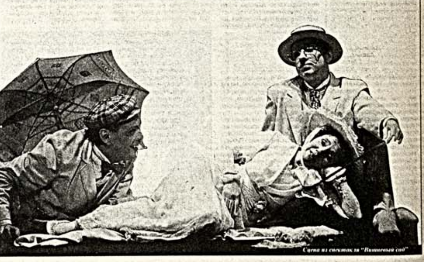
Сцена из спектакля "Вишневый сад"