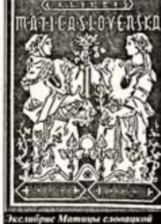
Еженедельник Матице словацкой

Приглашение из Братиславы на неделю быть гостем "Литературного еженедельника" и получить в конце октября Радужа, снова уныло город и землю, которые так давно не видел и о которых осталось столько приятных воспоминаний. Сбори не только, нужно было только найти миллион рублей для покупки в оба конца билета второго класса. И вот — поезда, следующие к берегам Дуная: уютный, холодный, разбитый вагон, обогранный разве только что сердечностью наших провинции; почти 50 часов пути и показавший мне странную "мезю" и вопросы таможенников на российско-украинской границе.