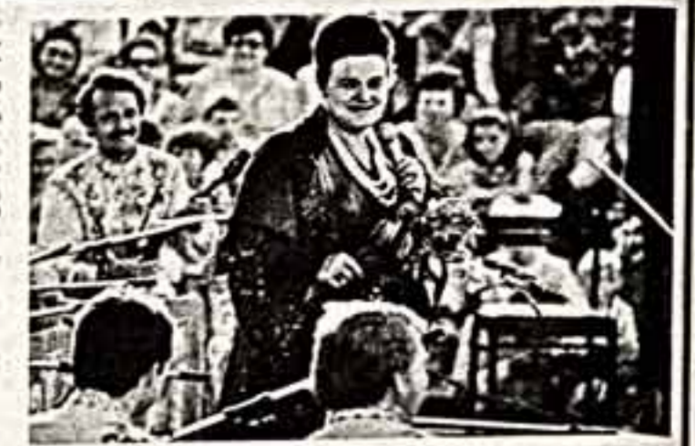
Теоретическое объединение «Экран» предлагает фильм-концерт с участием Л. Зыкиной «Все песни в гости».