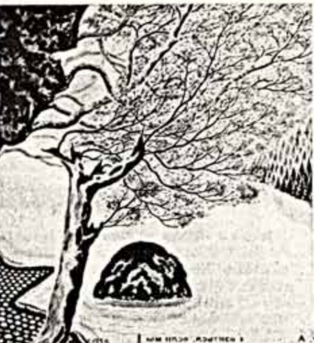
В музее разместились произведения графиков и каллиграфов. На верхнем зритель представит тридцать японских — участников выставки. Здесь же, расставив на полочках, они продемонстрировали виртуозное владение своим мастерством. Бумага, кисти, тушь — все готово. Сидя на коленях, художник не