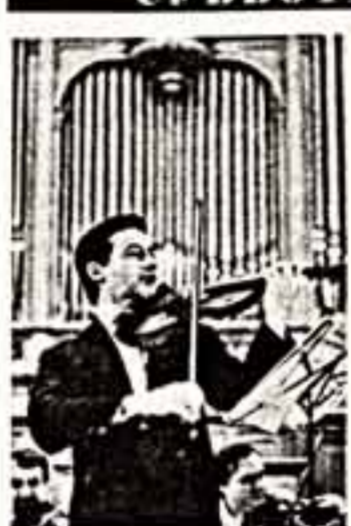
— 3 пр. 20.15.