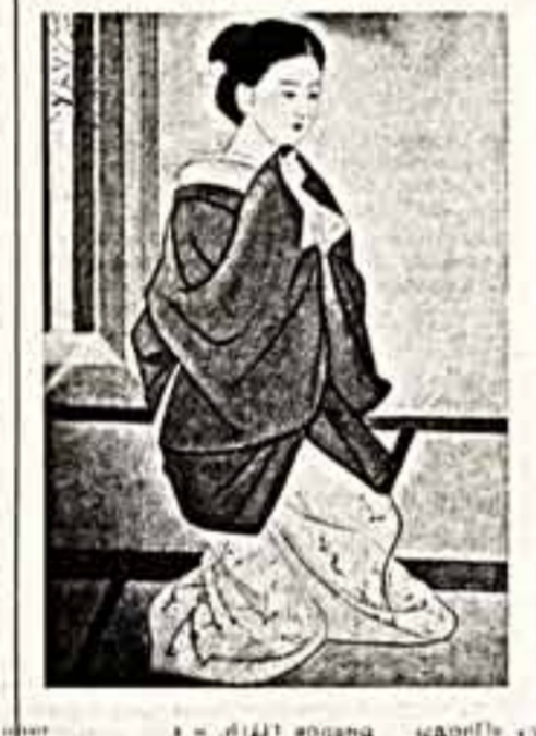
В залах Москвы экспонируются работы современных японских графиков, каллиграфов и живописцев.