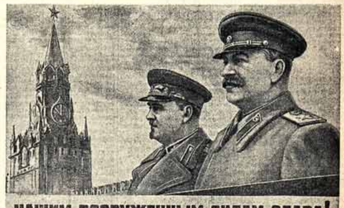
НАШИМ ВООРУЖЕННЫМ СИЛАМ—СЛАВА! Памятник художника В. Праздника, выпущенный издательством «Искусство» в 31-ю годовщину Советской Армии.

Будут проведены также творческие вечера-рассказы молодых исполнителей Московской филармонии, Московского хорового общества и других артистов. В дни съезда ВЛКСМ будут организованы выставки работ молодых артистов. В театрах оборудуют выставки на тему «Мастера искусств — воспитатели молодых зрителей».