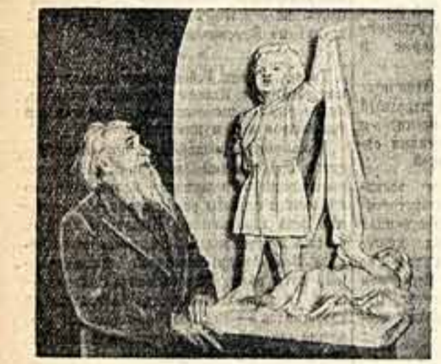
С. Т. Коненков.

Фикрет АМИРОВ, лауреат Сталинской премии. БАКУ.