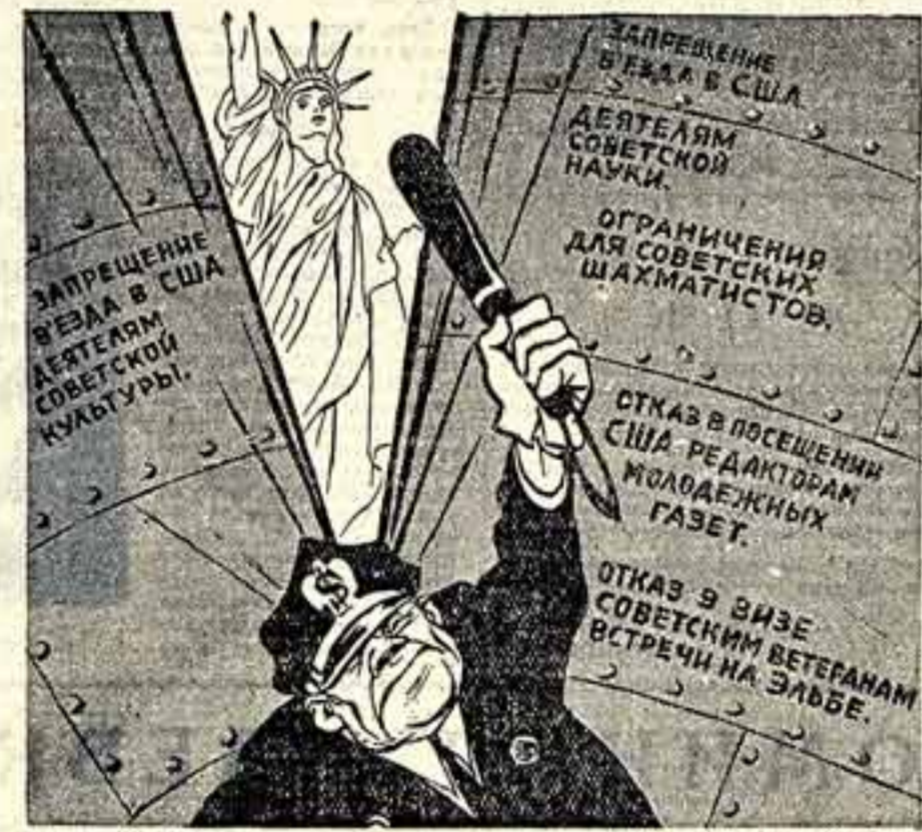
У закрытого завеса.