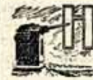
А отлогом берегу Волги, недалеко от речного вокзала, возвышается каменный постамент, увенчанный башней советского танка «Т-34». На постаменте надпись: «Здесь начинался передний фронт обороны 13-й гвардейской стрелковой дивизии генерала Родионова».

Сталинград! Великий город нашей земли, дышащий на протяжении жизни одного поколения Родины от смертельной опасности. Славный его каменит — он обильно полился кровью героев, верных сынов социалистической Отчизны. Имя Сталинграда стало синонимом непреодолимого мужества, железной стойкости, бесстрашной воинской славы советского народа.