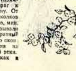
М. М. М.