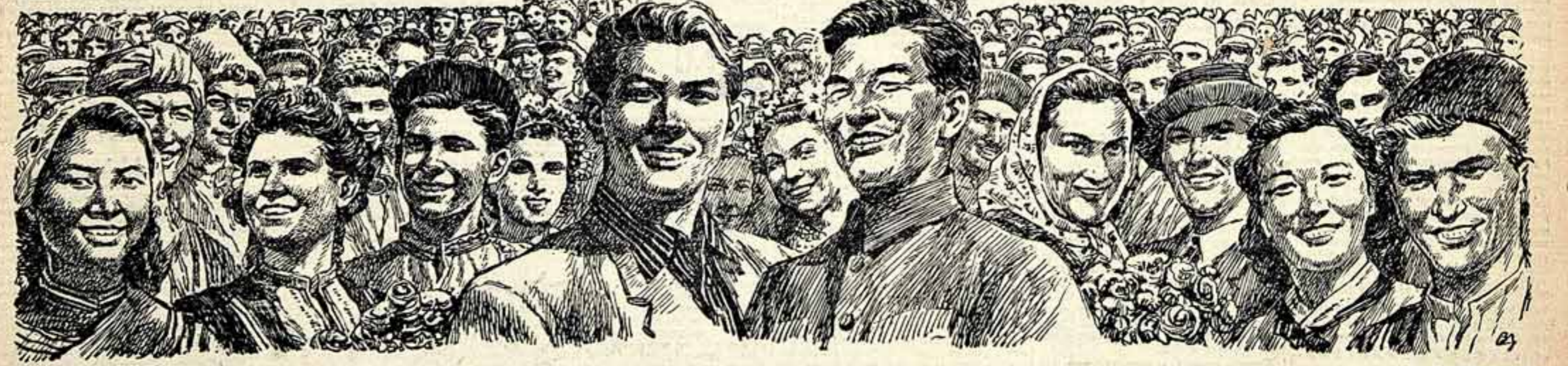
Рис. Ва. Добровольского.

ДА ЗДРАВСТВУЕТ И ПРОЦВЕТАЕТ БРАТСКАЯ ДРУЖБА НАРОДОВ СОВЕТСКОГО СОЮЗА — ИСТОЧНИК СИЛЫ И МОГУЩЕСТВА НАШЕГО МНОГОНАЦИОНАЛЬНОГО СОЦИАЛИСТИЧЕСКОГО ГОСУДАРСТВА!