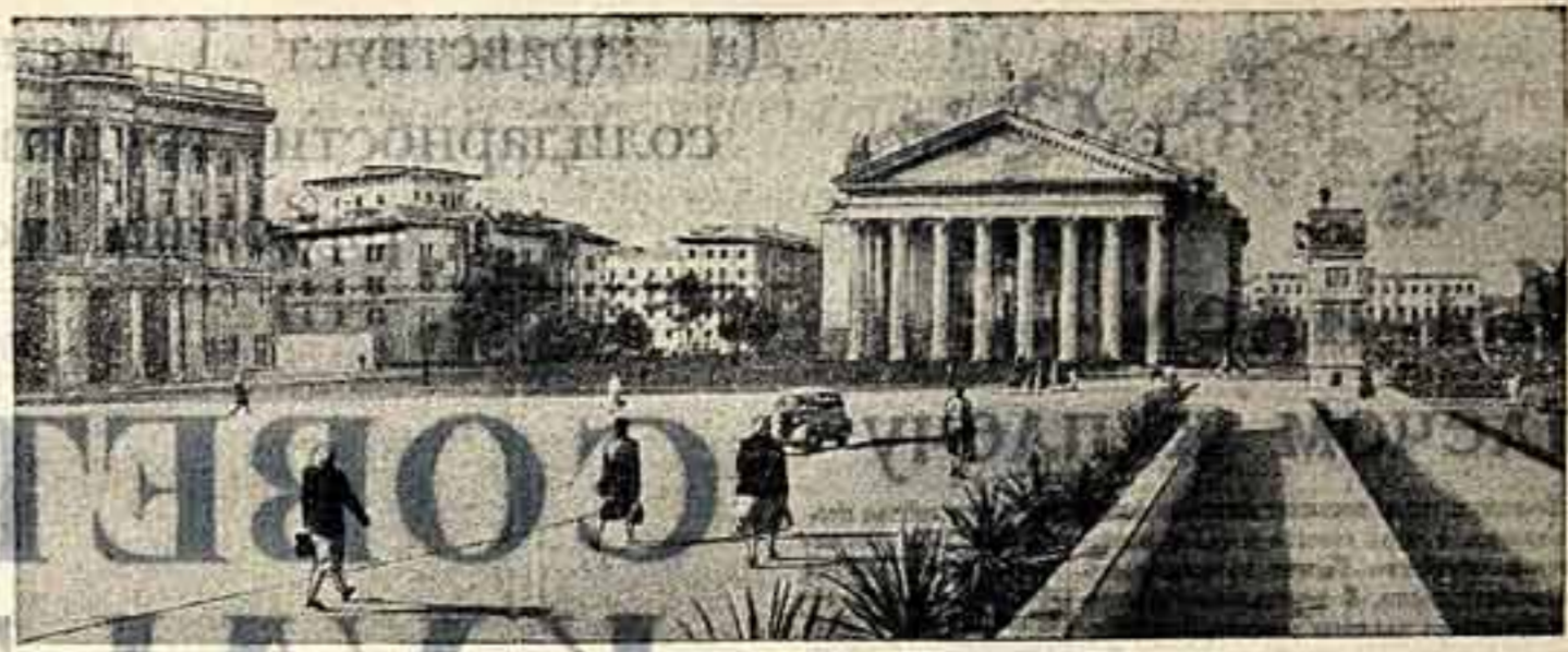
Площадь Павших борцов.