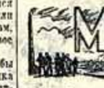
М. М. М.

В моем репертуаре было также немало образцов западной классики. Все слушалось с огромным интересом, все вызвало бурные восторги, и прежде всего потому, что многие наши слушатели видели в нас посланцев мира, граждан страны, которую они с полным правом, с глубокой убежденностью считают отцом мира, источником светлых надежд человечества.