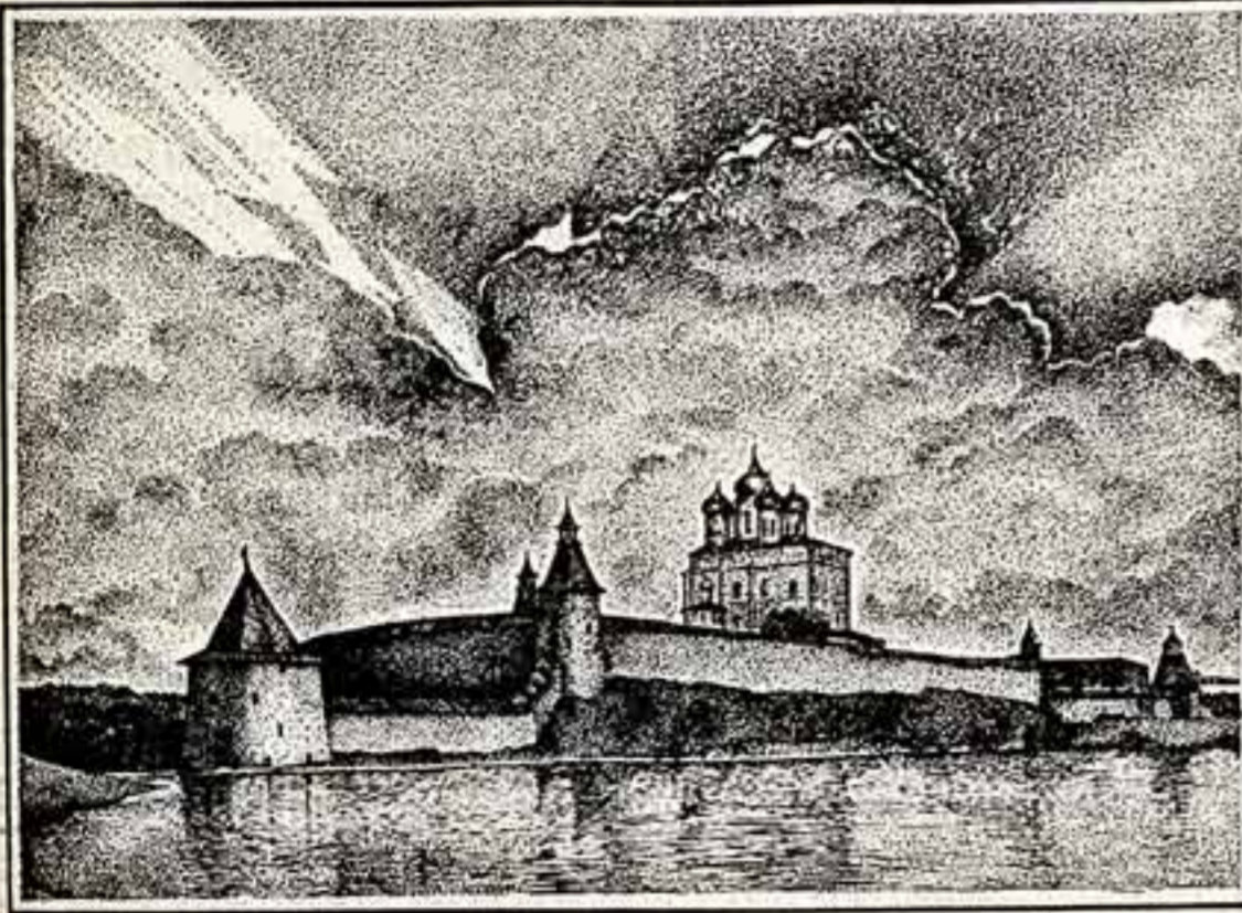
В. ОМЕЛЬЧЕНКО. «Псковский храм» и «Осень в Нескучном саду».