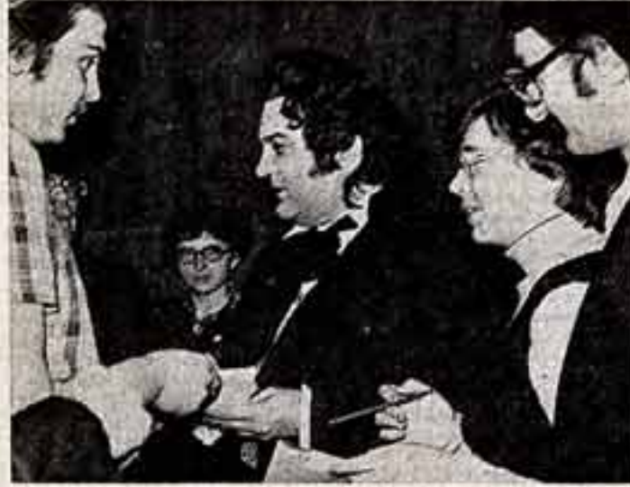
Николай Гедда дарит автограф.

Известно, что вы поете только на языке оригинала. Да, и знание шести языков значительно облегчает мне эту задачу.