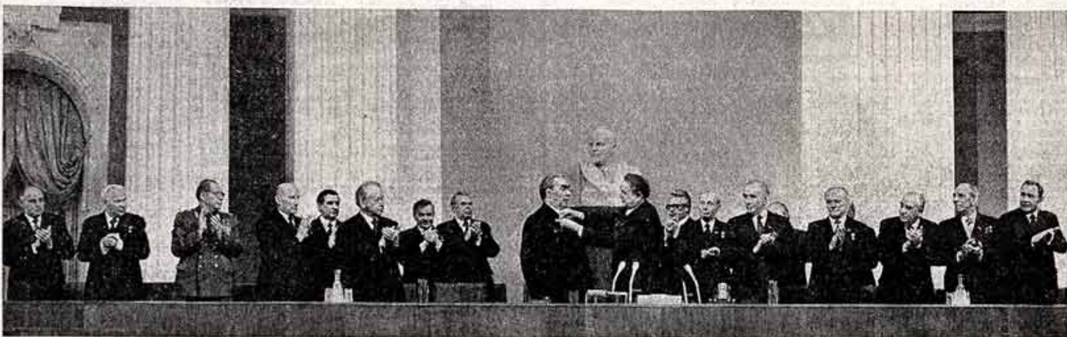
Во время вручения.

Отличительной чертой, простотой и открытостью повествования