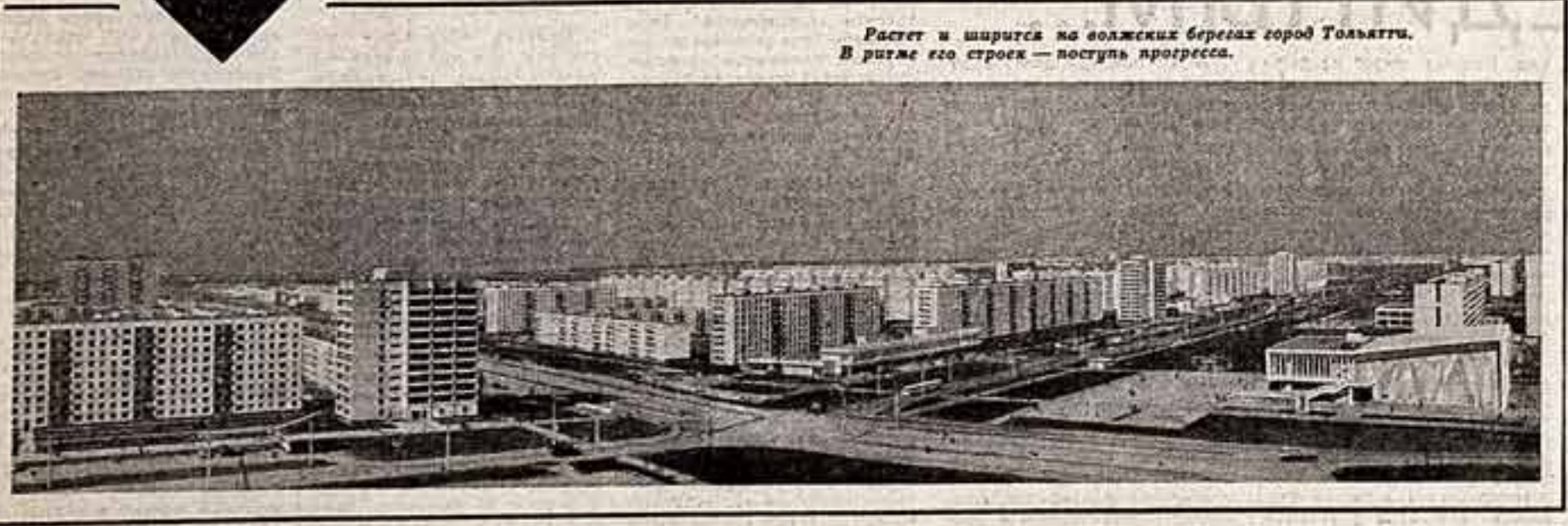
Растет и ширится на волжских берегах город Тольятти. В ритме его строек — посылка прогресса.