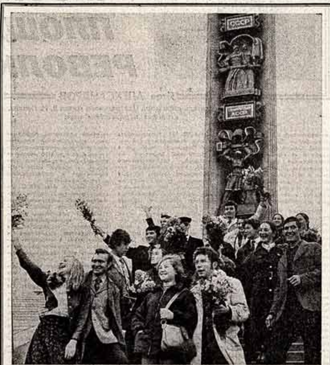
Пять лет назад эти ребята уехали из Ижевска в Москву учиться в Щукинском училище при Театре имени Е. Вахтангова. Главным удмуртским актерским мастерским, которой руководила М. Тер-Захарова, закончила учебу и вернулась в Ижевск. Выпускники влились в труппу Государственного удмуртского музыкально-драматического театра.

Что сегодня по телевидению? В этом вопросе — наш интерес к жизни, наше великое время, при посредстве телевидения вторгающееся в каждый дом.