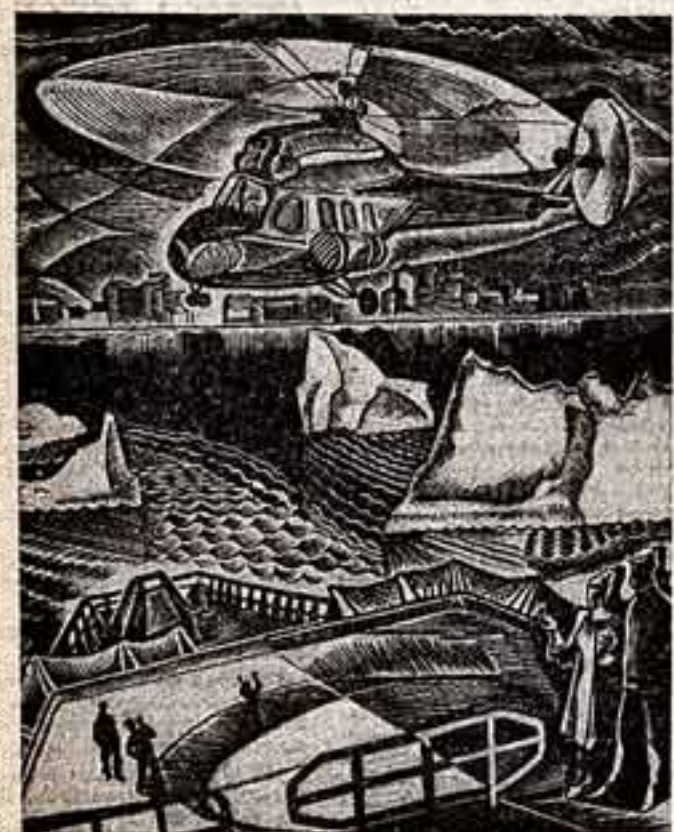
Р. Мнацаканян. «Стародесса». (Гиле). И. Благодюшин. «Возвращение с ледовой разведки». (Дьячкова).