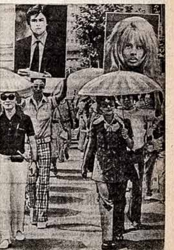
Мы уже сообщали о демонстрации японских актеров, дублирующих иностранные фильмы. Галерея требовала возмездия — увеличивать заработную плату.

В развале прикладного искусства — разнообразная мебель, миниатюрные иконостасы, подвесные чирнильницы, кресты, выполненные из камня, дерева, металла.