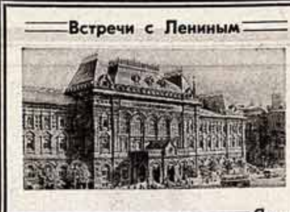
Встречи с Лениным

суждена Генеральному секретарю ЦК КПСС Леониду Ильичу Брежневу.