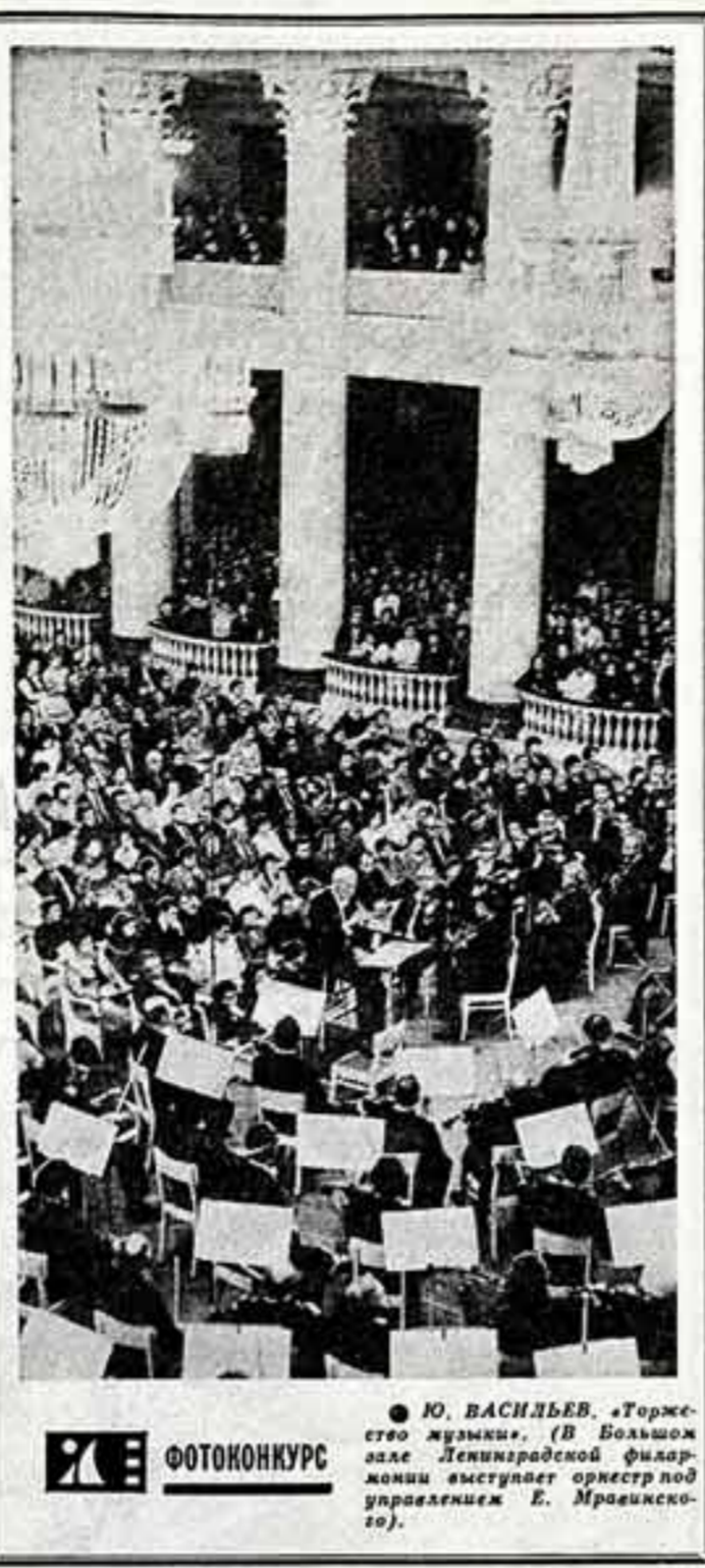
Ю. ВАСИЛЬЕВ. «Терпение жулика». (В Большом зале Ленинградской филармонии выступил оркестр под управлением Е. Мраинского).