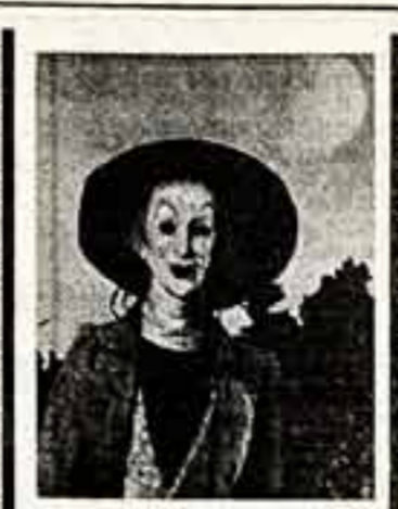
Известный писатель. Образы эти полны мужественной латентки, утверждая волю и достоинство человека...