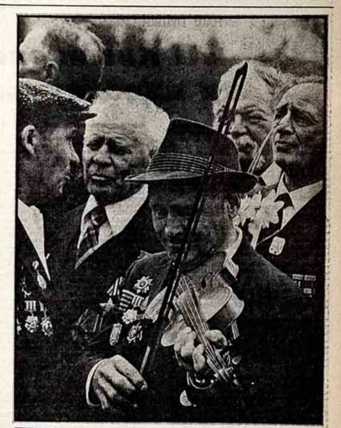
ФОТОКОНКУРС К. КОКОШКИН. «Солдатский вальс».