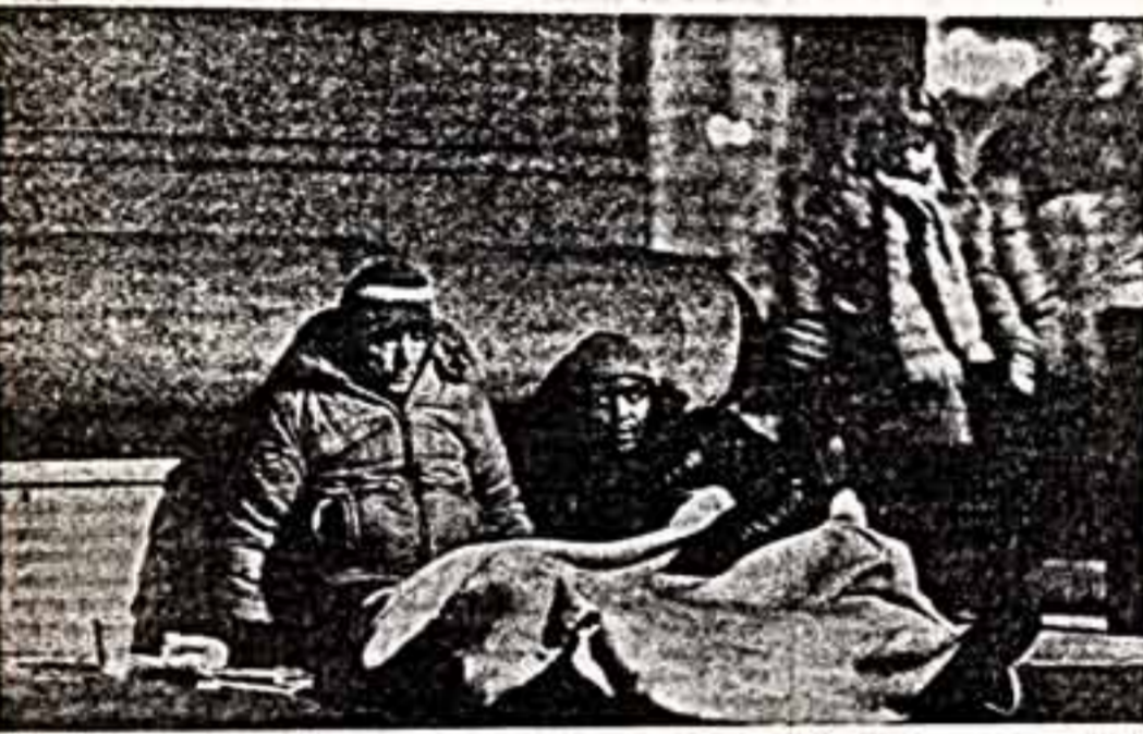
Сильные морозы, снежные заносы и другие трудности природы...