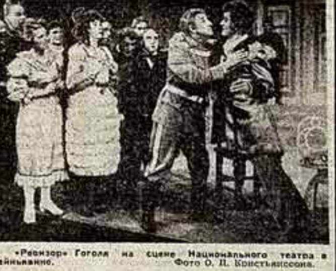
«Репертуар» Гоголя на сцене Национального театра в Рейкьявике.