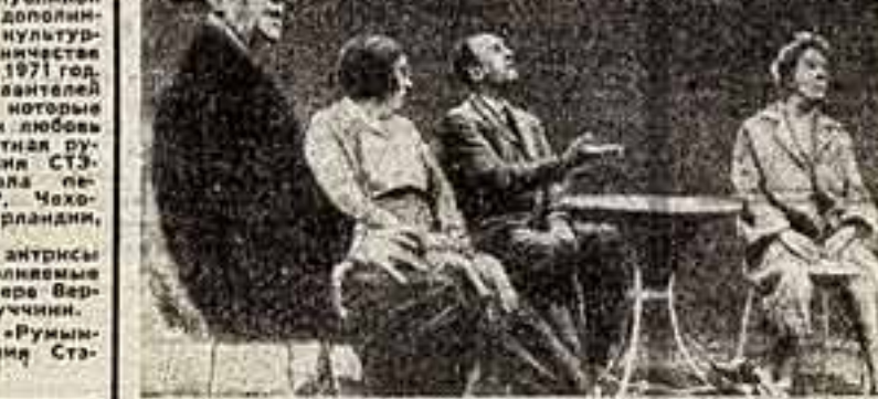
Сцена из спектакля «Дом».