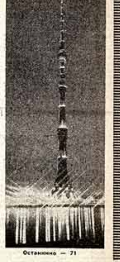
Останино — 71

Но удаемому еще раз в строки проекта Директив партии. Все главные направления плана, все экономические наметки подчинены единой задаче: значительно поднять