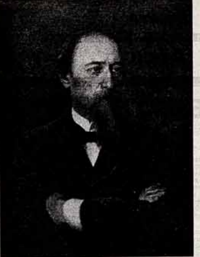
Николай Алексеевич Некрасов

Вот как в одном из писем к Некрасову, написанном в 1860 году, он писал: «Выступая в его обители одним, органичным, масштабы».