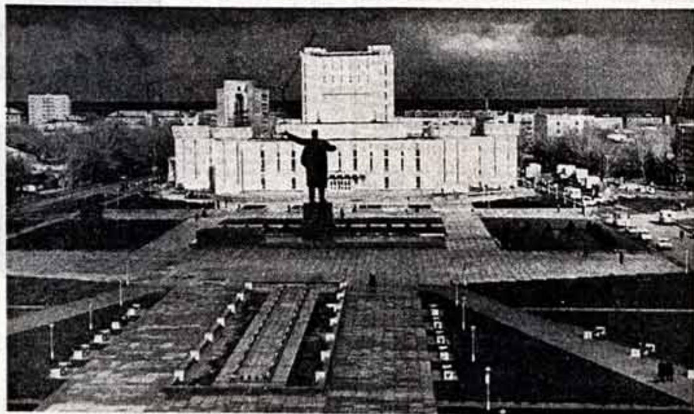
● Новое здание Драматического театра имени Абая со зрительным залом на 750 мест гостеприимно распахнуло двери в Семипалатинске. Авторы проекта — архитекторские бюро В. Белоусов, А. Вайер и О. Скарнов.

Сама по себе современная тема не может служить пропуском на выставку. Содержательные, как известно, должны соответствовать форме. Плохая картина или монументальное панно не только не помогают эстетическому воспитанию народа, но приносят идеологический вред, ибо советские люди хотят слышать от художника страстное, убежденное партийное слово правды — правды о времени и о себе. От мастера изобразительного искусства мы вправе ждать больших открытий, глубокого постижения современности.