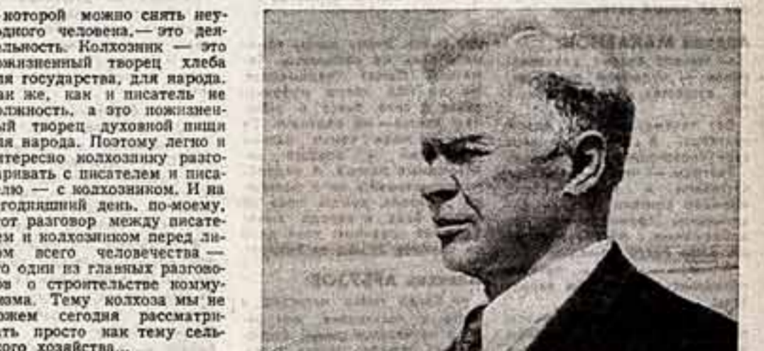
А. ДОВЖЕНКО.

И вот я думаю, что будущее обществу книголюбов предстоит изучить читательские слухи, оказать действительную помощь издательству в составлении тематических планов, куда вошли бы издания действительно нужные, необходимые людям.