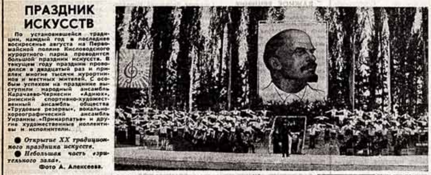
ПРАЗДНИК ИСКУССТВ По установленной традиции, каждый год в последние дни августа на Первомайском поле Исловодского курортного парка проводится большой праздник искусств. В этом году праздника проводился в двадцатый раз и привлек многие тысячи туристов со всей страны и из ближнего зарубежья. С особым успехом на праздник выступили народный ансамбль Кабардино-Черкесии «Аджарский ансамбль спортивно-художественный ансамбль общества «Трудом» Гезерова, фольклорно-хореографический ансамбль Украинцы «Прикарпатье» и другие художественные коллективы и исполнители. ● Открытие XX традиционного праздника искусств. ● Небольшая часть зрительского зала.