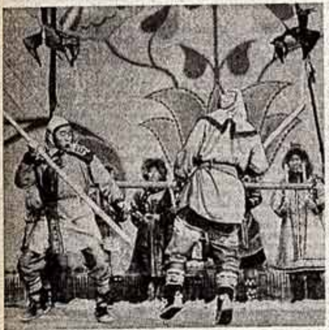
В Хабаровском крае хорошо известна коллекция художественной самостоятельности якутского села Булава. Особой ее репертуар стали народные танцы и песни. В этом году самостоятельные артисты с успехом выступали на Хабаровском смотре художественной самостоятельности и стали ее дипломантами.