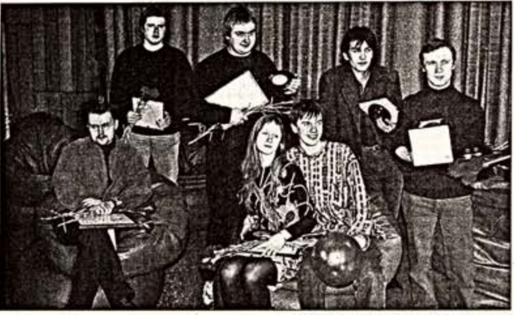
Победители фестиваля "Святая Анна"