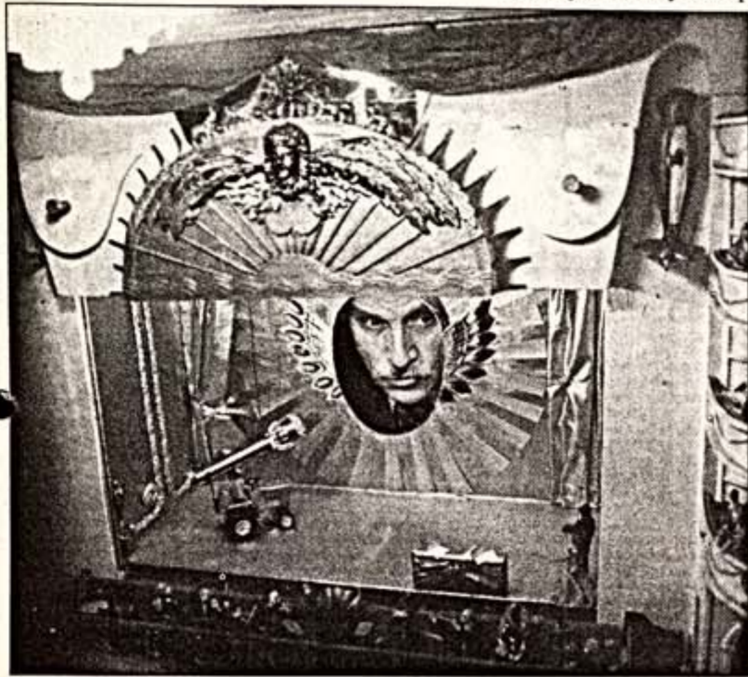
"Говорящая голова" М.Ульянова в лиликанском королевстве

"Золотую Маску" открыл лиликанский народец