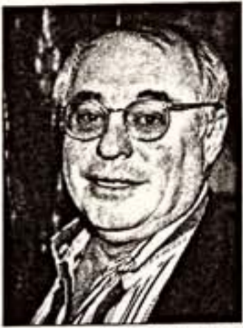
М.Розовскому — 65

Возраст Марка Розовского — та категория, которая словно заведомо противоречит паспортным данным. Если про жизнь принято говорить, что она выглядит, то возраст режиссера, наоборот, следует вычитать из общего энергетического заряда его спектаклей.