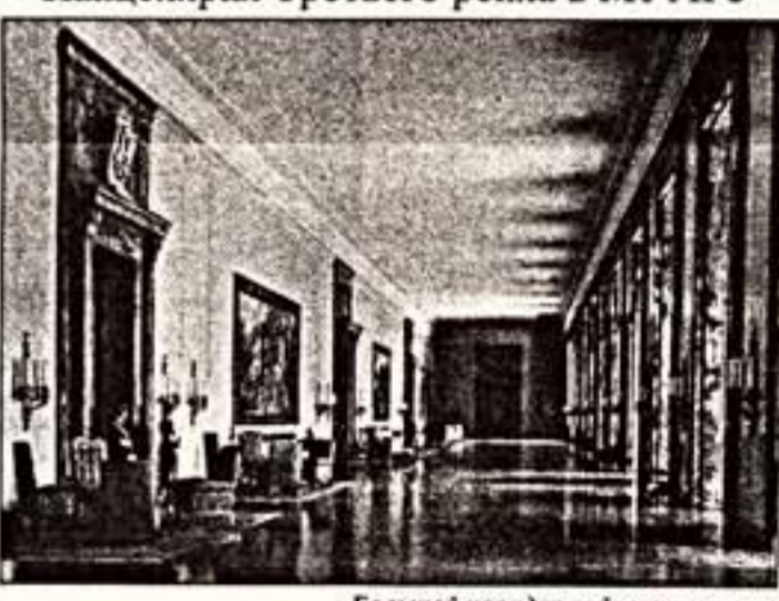
Большой коридор рейхскапеллерии

Слова "трофей" и "спектр" по отношению к музейным предметам уже давно окутаны дымкой самых невероятных драматизмов. Мы готовы верить в невероятные совпадения, открываем под заголовками музейных номеров, и ждать грандиозных сенсаций. Они действительно еще есть, хотя, возможно, и не совсем те, в которые верили и которых ждали.