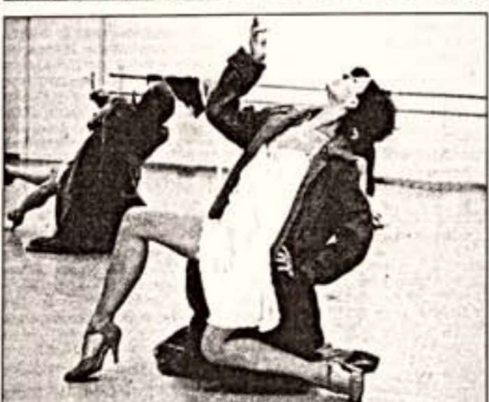
Сцены из спектакля