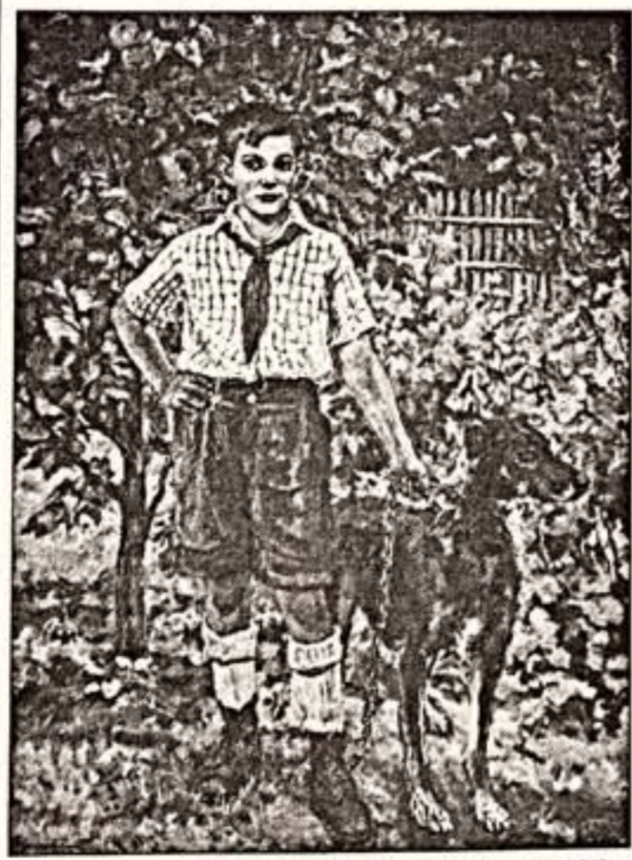
П.Кончаловский. "Андрон с собакой". 1949 г.

на построения пространства картины, которому он всегда, даже в своих самых "бугарских работах", следовал неслучайно, стала главной в выступлении Ирины Александровны Антоновой на открытии выставки "Неизвестный Кончаловский".