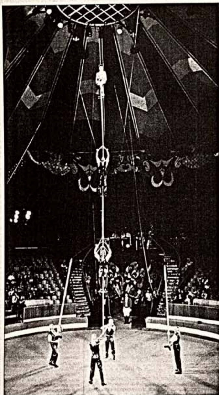
На арене - "Рекордсмены мира".