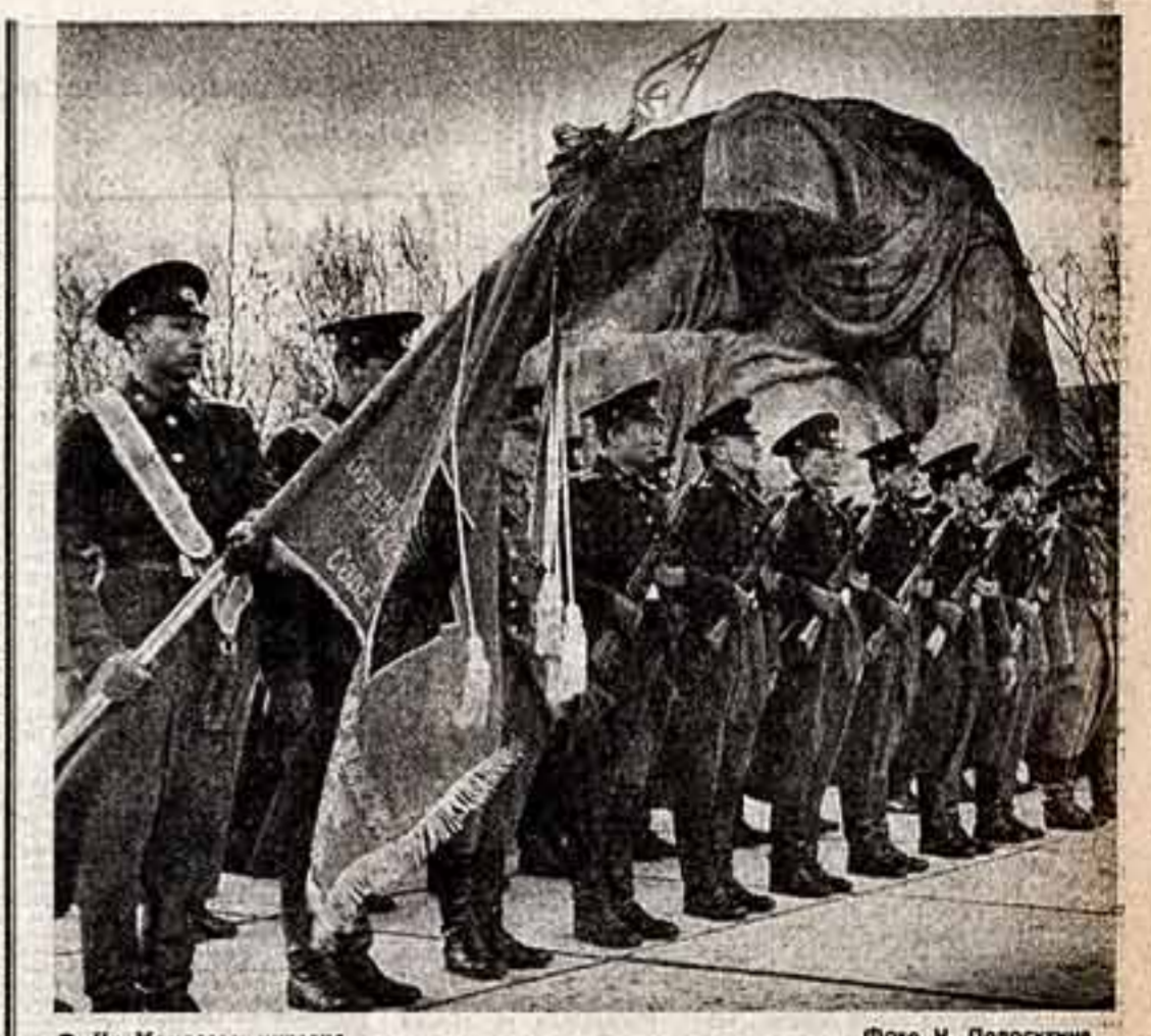
На Мамлеев кургане.