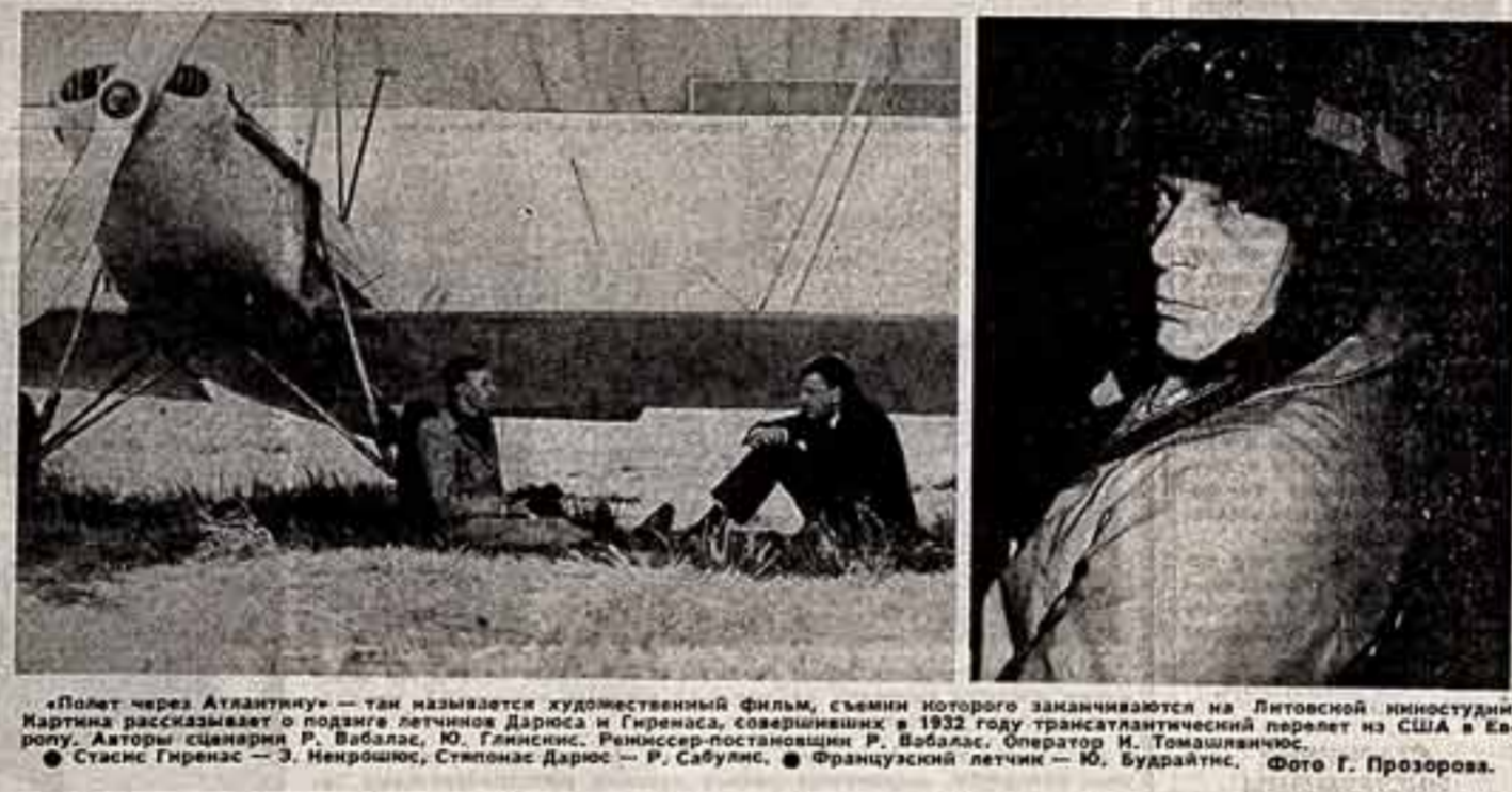
«Полет через Атлантику» — так называется художественный фильм, сценарий которого...

в хорах и ансамблях ГАСТРОЛИ ПРОШЛИ УСПЕШНО