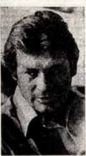
Известный польский актер Станислав Микюльский