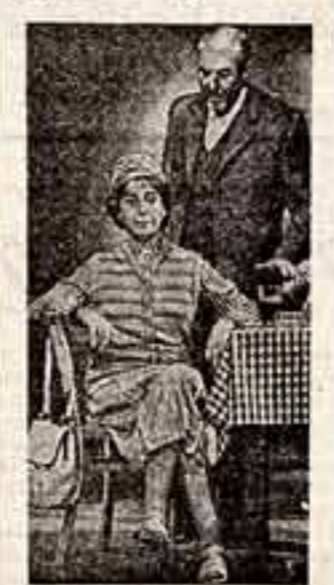
С большим успехом идут пьесы русских и советских драматургов на сценах английских театров. Зрители Норфолкского шекспировского театра в Лондоне тепло встретили пьесу М. Горького «Зыковы», «Старомодную комедию» А. Арбузова. В театре «Ситизен» в Глазго идет драма Лермонтова «Маскарад», впервые поставленная в Англии.

Познание культурного уровня населения, подготовка национальных кадров относятся к числу важнейших задач, стоящих перед Алжирской Народной Демократической Республикой.