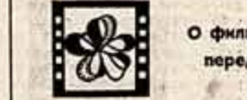
О фильмах «Ключ без права передачи» и «Розыгрыш»

Но во всем ли при этом правы юные «силачи»? Такой ли уж всегда зрелый их оптимизм?