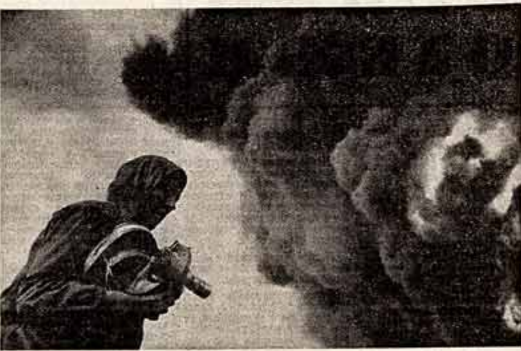
Р. МУХАМЕТЗЯНОВ. «Тревожные будни кинохроникера»