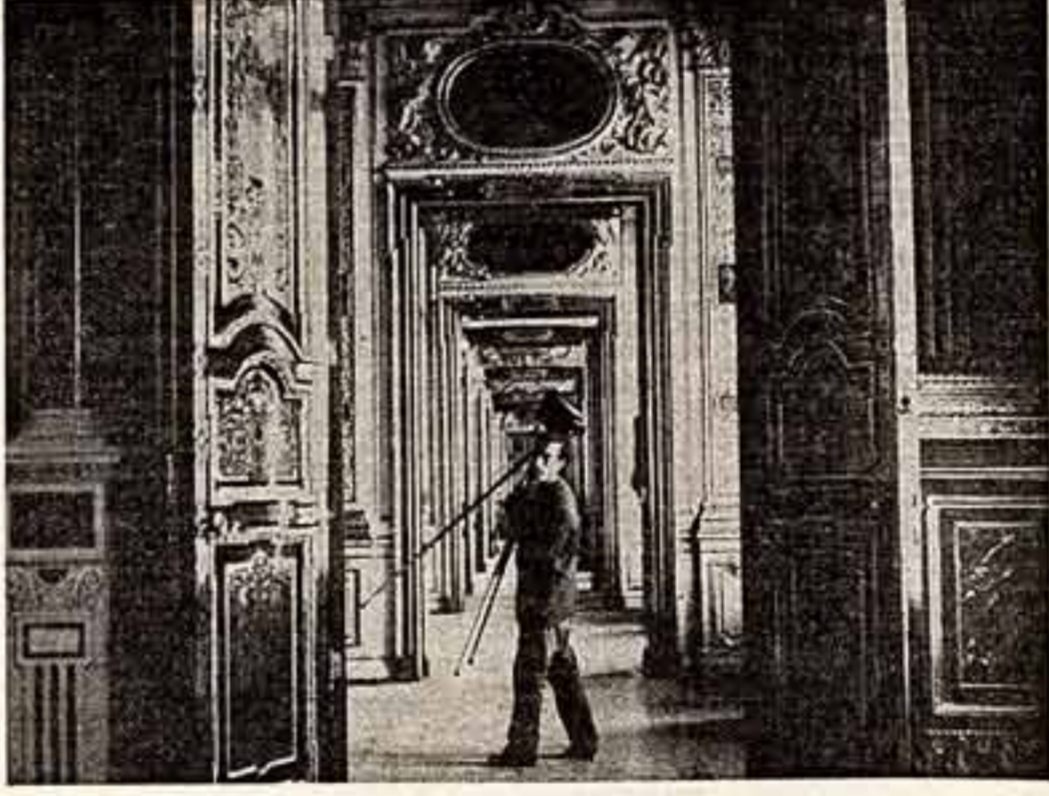
М. МИШКИН. «Баш вивает, корр. вильнюс»