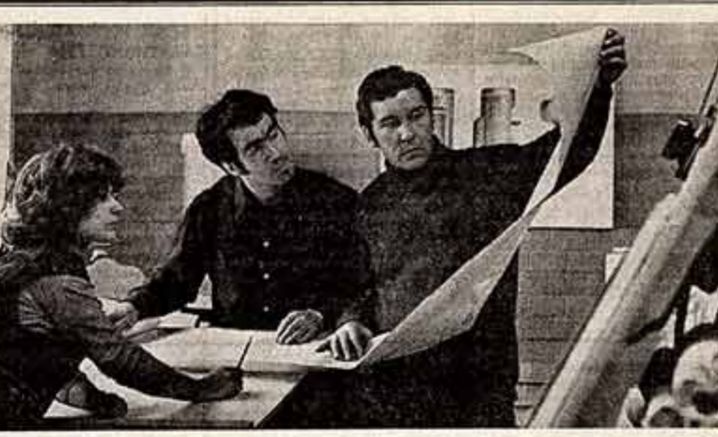
Конек ведут дизайнеры