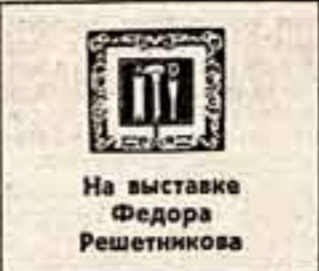
На выставке Федора Решетникова