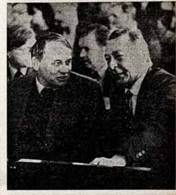
Народные артисты СССР В. Наумов и О. Ефремов. Д. В. Киселева.