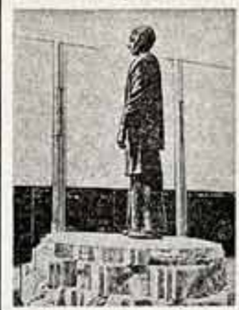
В будапештском районе Кебеля открывает новый памятник. Работа скульптора Беам Тота и архитектора Тамаша Тота посвящена египетскому ученому и путешественнику Шандору Кершчу Чома (1784—1842). В этом году международная общественность отмечает 200-летие со дня рождения видного исследователя Азии, замечательного ученого, писателя и культурного работника Востока.

Двумя премьерами открылся свой 104-й сезон Пражский национальный театр. На ведущей сцене страны с большим успехом прошли чешские «Ван-клевый сад» и «Ирисы Галилея» Брехта. Интересные встречи поклонников театрального искусства обеспечили вечерами других театров чехословацкой столицы. Урашаем на насыщенный театральный сезон станут традиционные гастроли ведущих советских театров.