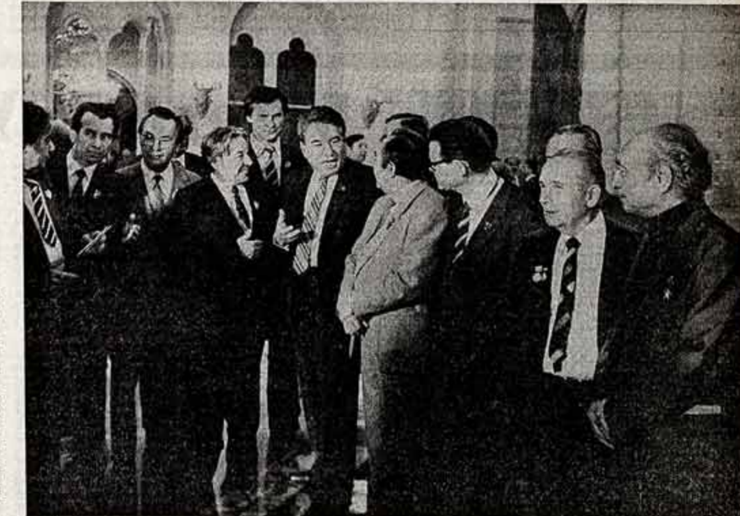
Группа участников пленума во время перерыва.