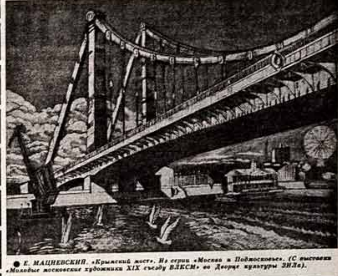
Г. МАШЕНСКИЙ. «Крымский мост». На серии «Москва и Подмосковье». (С выставки «Молодые московские художники XIX съезда ВЛКСМ» во Дворце культуры ЗНЛ).

Легко в эти края песни. Директор Дома культуры рассказал нам, что ему приходится переписывать новые песни с пластинок, магнитофонных лент и раздавать листовки с нотами и словами всем желающим, поскольку даже сравнительно недавно вышедшие из печати сборники довольно часто составлялись из произведений