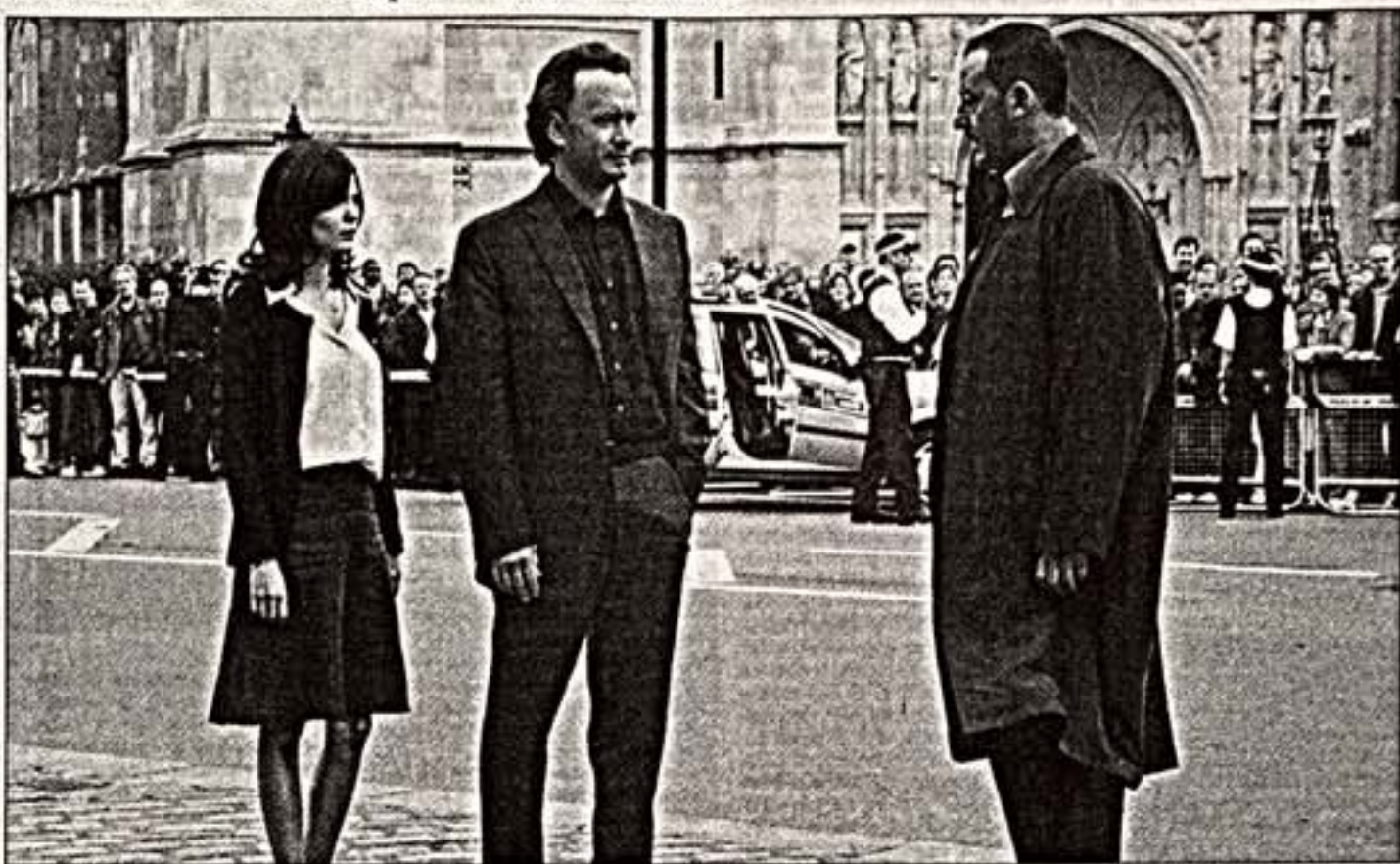
Кадр из фильма "Код да Винчи"