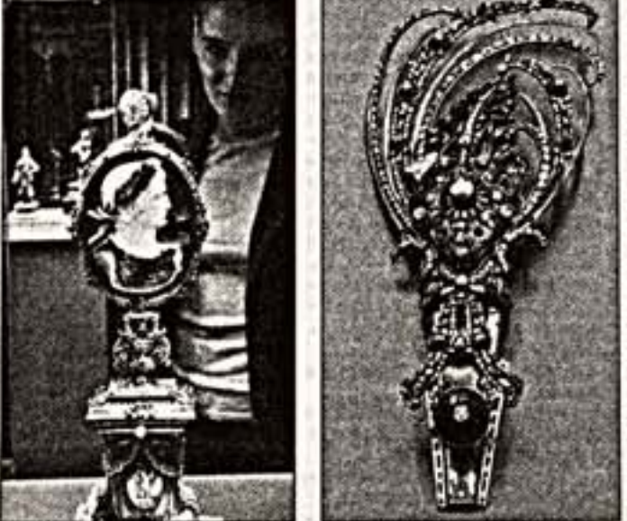
И.Долганов. "Кабинетное украшение с портретом-каменей римского императора" (слева) и "Эрет для виллы из кармелитского ордена"