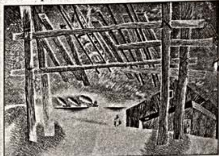
В.Петров-Камчатский. "Пароход с Большой землей", 1972 г.

Северные грезы Виталия Петрова-Камчатского