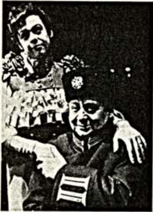
«ПОСЛЕДНИЕ» М. ГОРЬКОГО В ТЕАТРЕ ОЛЕГА ТАБАКОВА