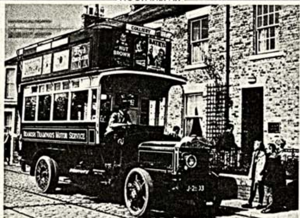
КАК ТОГДА, В НАЧАЛЕ ВЕКА...

во все концы заповедника. Бакалейная и галантерейная лавки, кондитерская и мясная фабрика — это тоже экспонат музея. Он заблаговременно оснащены предметами и приспособлениями, бывшими в ходу в первые годы нашего столетия. Обслуживающий персонал музея, облаченный в костюмы тех времен, рассказывает гостям об истории региона.