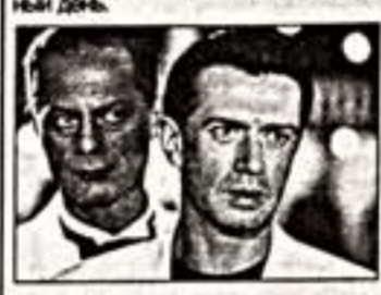
— грустно, горючо и в то же время весело и светуло причту о нашей действительности. Мы ждали столь же талантливую картину, тем более что сам режиссер не отступил на аванс: в центре фильма — война русских секретных служб против молодого свободного идеализма. Каждая из его побед есть на самом деле поражение нежданно — такова трагедия этого сверхталантливого индивидуума, который оптимистично все наиболее созидательное в современной России и в то же время все худшее! Интриговало и то, что в главной роли сыграл Владимир Машков — едва ли не самый успешный на сегодняшний день российский актер. Увы, интрижка не оправдалась. Лучшим шаг за шагом старательно выстраиваясь "русско-капиталистический образ жизни" режиссер, и исполнителю главной роли, которому, по большому счету, и играть-то было нечего, образ этот выливался изощренным и плоским, а то и просто фальшивым.