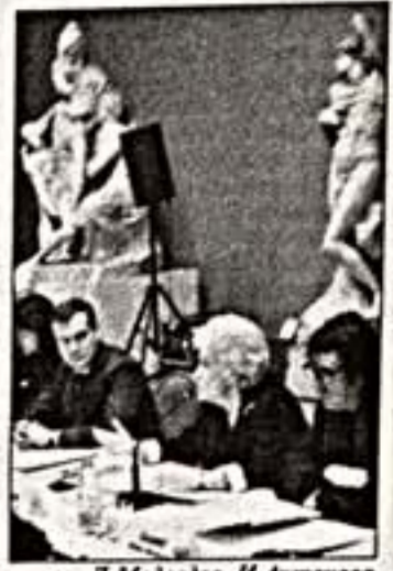
Д. Медведев, И. Антонова и Ю. Башмет

ромы-инженеры возводят уникальную научно-библиотечную и архивную, там же устроит многофункциональный концертный зал, выставочный комплекс и офисы. Не забыли ни страшная проблема парковки (150 машин уместится под землей), ни экологию — в уютном сквере Фостер собирается закрыть автобусное движение и насаждать любимые деревья, разбить сады и озера. А еще кругом будут кафе и магазины: кафе, сувениры и книги без труда можно купить в Лувре, Метрополитен и прочих мировых музеях-гражданах. В Московском же сквере, конечно, тоже есть минимальный сервис, но уж очень он неважный, а главное, кто-то в какой-то угол. Вряд ли он подойдет тому потоку посетителей, который ГМИИ собирается принимать в недалеком будущем: с нынешних 800 тысяч человек в год число зрителей возрастет до трех, а затем и пяти миллионов. Цитры поражают воображение, но обдумать стоит реальность. Вязь ГИИ Государственный музей изобразительных искусств имени А.С.Пушкина — не только музей, но и культурный центр, и реконструкция должна ему готово предоставить. На заседании Попечительского совета Фонда ГМИИ присутствовал первый вице-премьер Дмитрий Медведев, один совет и возглавляющий, плюс масса крупных руководителей и деятелей культуры. Концепция Нормана Фостера — шаг вперед, но в последнее вторжение в архитектурно-градостроительную среду центра Москвы — одобряют, финансовую поддержку обществу. Как движется реконструкция, мы непременно расскажем на следующих страницах.