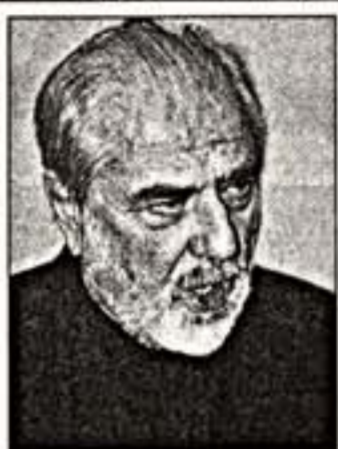
Вверху: М.Пистолетто. Внизу: М.Пистолетто