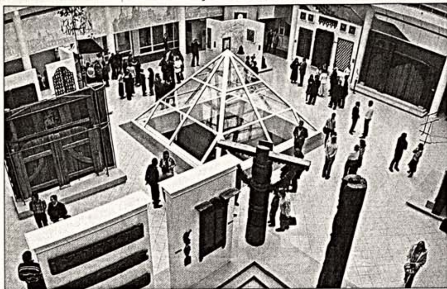
Вверху: 1000 квадратных метров истории архитектуры. Внизу: русский зодчий

В Коломенском открыто новое фондохранилище