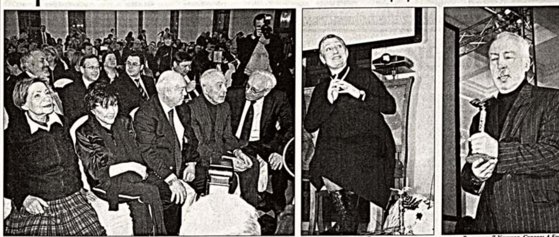
Слева: почетные гости церемонии. В центре: Л.Улицкая. Справа: А.Битов

В прошедший четверг была определена очередная обнова лауреатов "Большой книги". Эта литературная премия, вручаемая впервые в прошлом году, по меньшей мере трижды "самая": самая демократичная (по сумме индивидуальных вознаграждений), самая буржуазная (по форме проведения церемонии) и, наконец, самая вышительная (по объему вознаграждения).