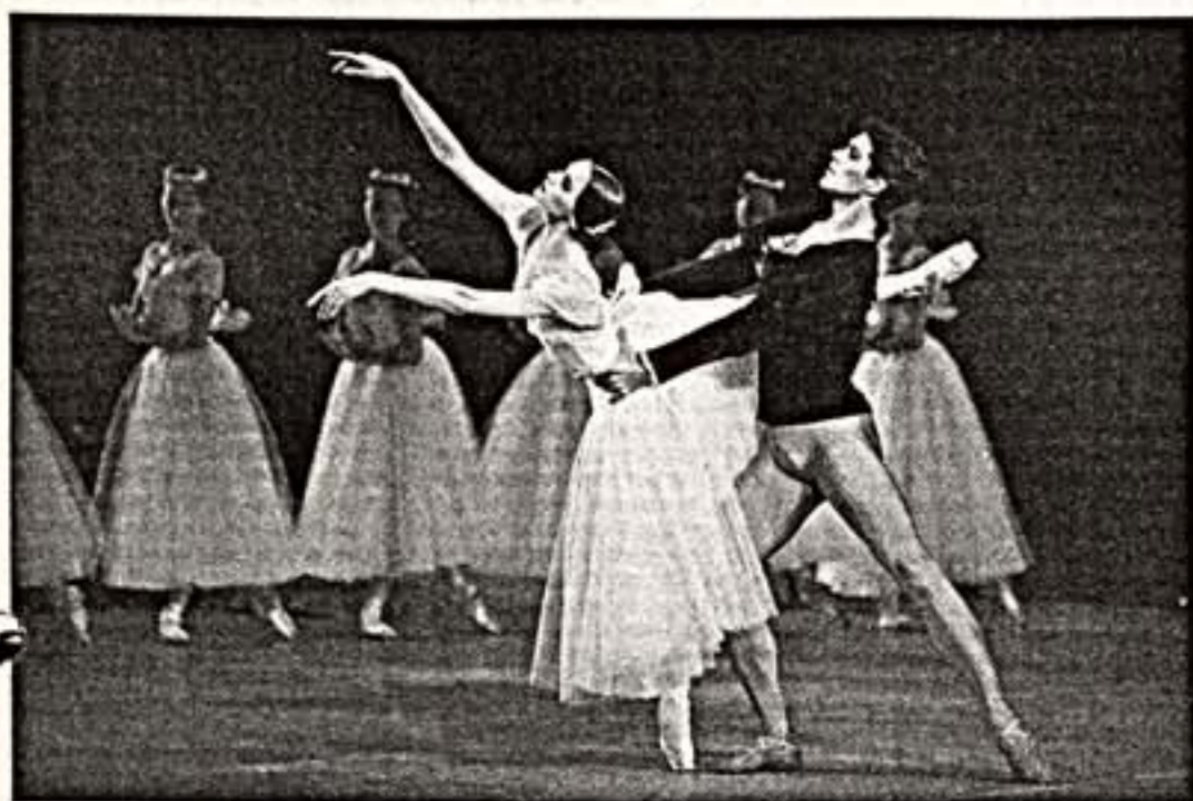
С.Заварова — Жюльетта и Р.Болле — Альберт в спектакле

Роберто Болле в спектакле Большого театра