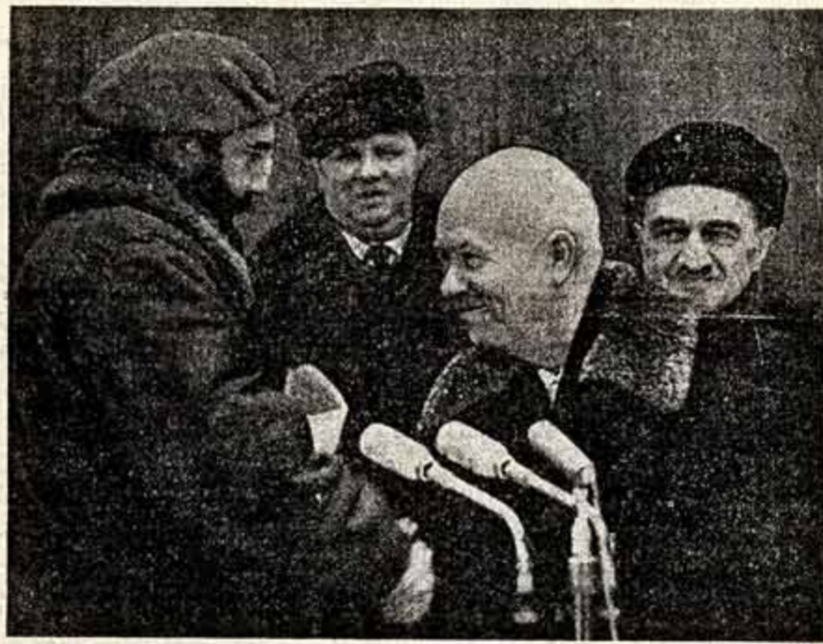
Прибытие в Москву Первого секретаря Национального руководства Единой партии социалистической революции Премьер-Министра Революционного правительства Республики Куба Фиделя Кастро Рус.