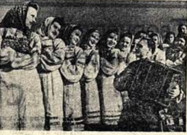
При Яресской правильно-гидравлической фабрике имени Малютова (Смоленская обл.) третий год существует самодеятельный русский народный хор. В его репертуаре свыше 200 песен. Коллектив с большим успехом выступает перед рабочими фабрики и в колхозах района. На фото: выступление участников хора.

А. МОРЕЕВА, зав. отделом народной поэзии ВДНТ им. Н. К. Крупской.