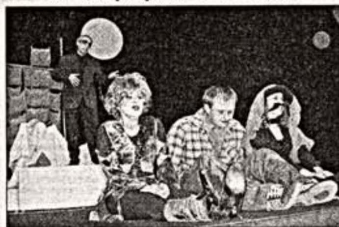
Сцена из спектакля "До третьих петушков"