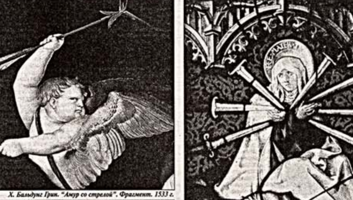
Х. Балдин Грич. "Амур со стрелой". Фрагмент. 1533 г.

Фрайбургские гуманисты гостят в Гамбурге