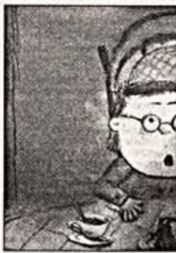
Кадр из фильма "Лullaby"

Фестиваль проходил во время школьных каникул, но в зрительном зале "Художественного" театра в Москве было много взрослых зрителей. И это не случайно. В последние годы анимация в России переживает настоящий подъем. И это не случайно. В последние годы анимация в России переживает настоящий подъем. И это не случайно. В последние годы анимация в России переживает настоящий подъем. И это не случайно.