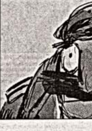
Кадр из фильма "Ouzumel"

Каждый кадр в фильме "Лullaby" — это картина из жизни. А картина из жизни — это картина из жизни. А картина из жизни — это картина из жизни. А картина из жизни — это картина из жизни.