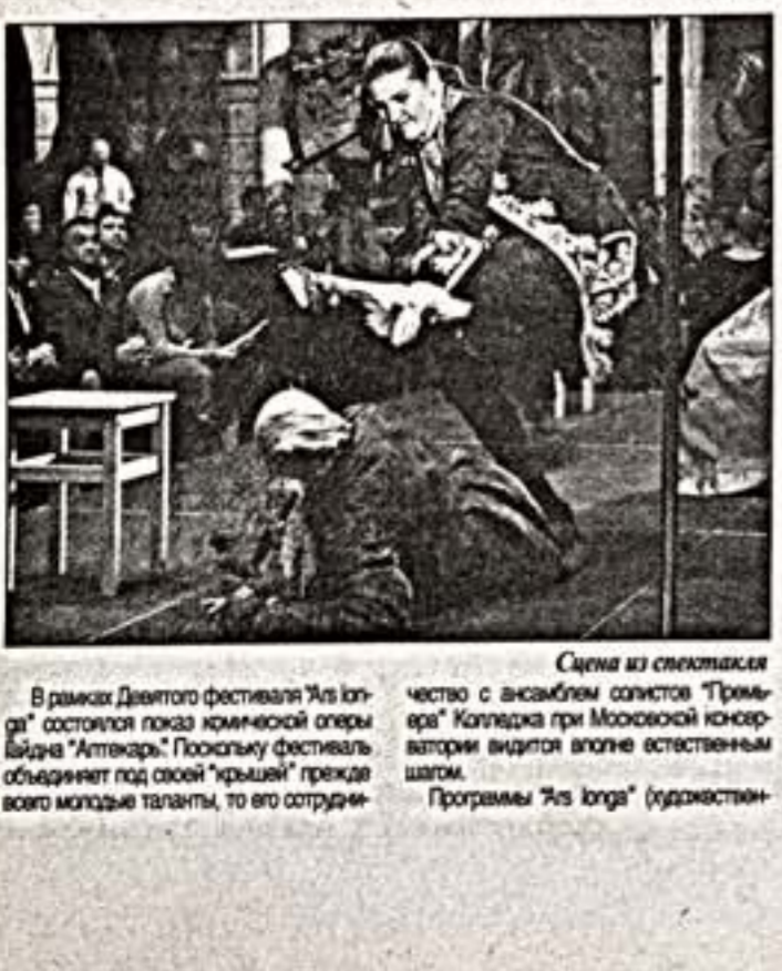
Сцена из спектакля...

"Аптекарь" Гайдна в Галереи искусств Зураба Церетели