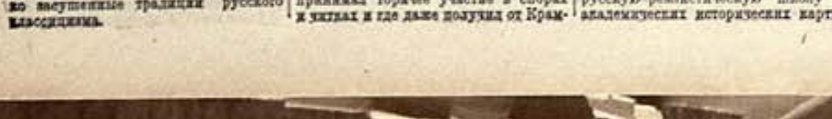
М. М. Антокольский. С фотографии 1868 г.

Весоюзный комитет по делам искусства организовал Государственный духовой оркестр СССР.