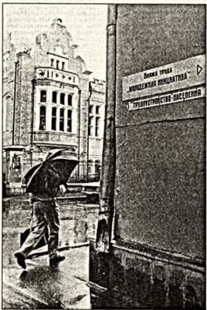
Теперь, наконец, мы оживаем, однако по природе человеческой лекарства действуют медленнее, чем болезни, и как тела наши растут медленно, а разрушаются быстро, так и таланты легче задуться, чем породить или даже оживить, ибо и безделье тоже имеет свою сладость, и правды, ненавистная сначала, тоже становится приятной...