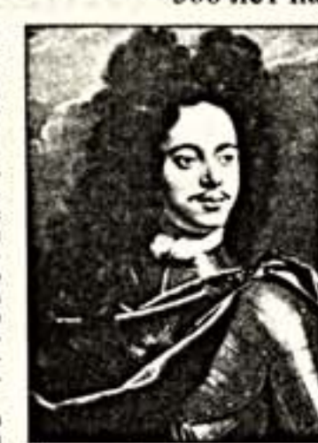
Москва, но Петр и Россия, Петр и Запад во всем многообразии этих отношений.

Выставка "Петр Великий и Москва", открывшаяся в залах Инженерного корпуса Государственного Третьяковской галереи, могла состояться только сейчас, только в наше время, раньше ее устроить было бы немалым. Естественно, дело не в личности Петра — он почитался всегда, всеми властями и режимами, правда, подчас с некоторыми идеологическими оговорками. Его заслуги в создании великой державы, великого государства Российского всегда были неоспоримы. Но совсем иное — в каком ракурсе их рассматривать, в каком историческом контексте, в какой связи с современностью.