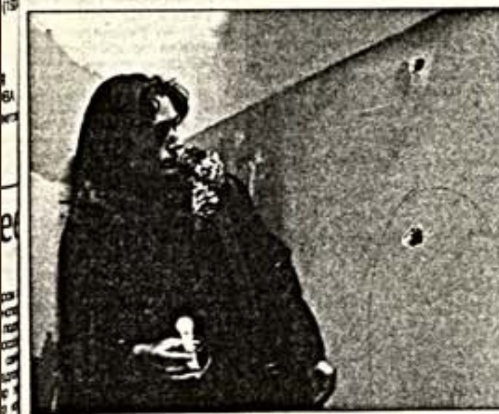
Место преступления. Следы пуль обведены оперативниками