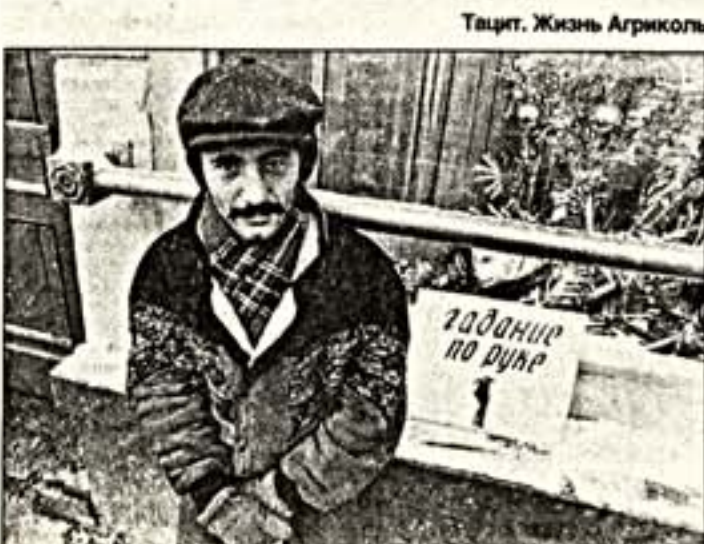
Тайтл. Жизнь Агримолы