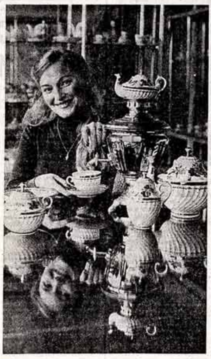
Большим спросом пользуются изделия Ленинградского фарфорового завода имени М. В. Ломоносова...