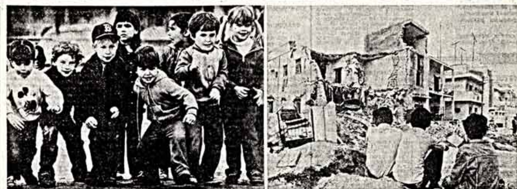
«Я и дядя бы, наверное, не прожили на свете, если бы детство родины в моем сердце заглушили». Духавица в эти строки Ингрид де Уиньяно. Детство, весна нашей жизни. Растет человек, жалея вечно, а себя окружающий мир. Уандино, услышавшее, прочитавшее в эти стремительные летящие годы отражается в сознании непреложной истинностью первых впечатлений, навечно войдет в плоть и кровь. Посмотрите на этих американских ребят, увлеченных игрой [язык смычок]. Пусть пройдет