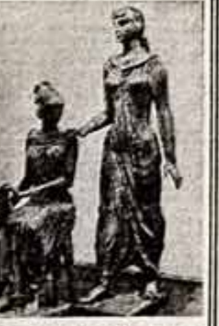
«Болгарские предания и легенды» — так называется художественная выставка...