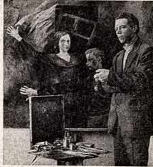
Художник Михаил Савицкий. Только что, в праздничные дни октября, ему присуждена Государственная премия СССР. Это художник проникновенного и мужественного таланта. В память о тех, кто сражался в годы войны, пишет он свои полотна. Его холсты словно наложены нестынным жаром, в великой непокорности своей встает на них партизанская Беларусь. Ее незабытый гнев, ее незабытые страдания соединились в искусство художника. В Минском музее Великой Отечественной войны он написал на стене пламя, в котором — противоборство злойблудной тьмы и отчаянного очищения. Эта страстная и напряженная живопись задерживает заты Славя музеев, где поминуются полки и дивизии, освобождавшие родимый край художника. В честь огненной правды, в попарение тьмы звучит его слово.

В Москве проходит Международный симпозиум представителей книгоиздательских центров социалистических стран. С докладом «Практическое применение принципов новой системы планирования и экономического стимулирования в книгоиздательском деле и дальнейшее развитие сотрудничества между книгоиздательскими центрами социалистических стран в области экономики» выступил член коллектива Госкомиздата СССР И. Коржавин. В симпозиуме принимают участие делегации Болгарии, Венгрии, ГДР, Кубы, МНР, Польши, Чехословакии и представители общественных организаций и республик СССР. Симпозиум примет рекомендации о сотрудничестве разных стран в области издательского дела.