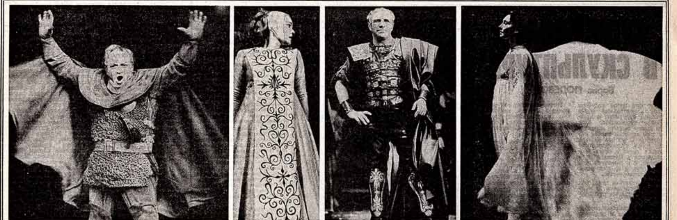
Шекспир на сценах Москвы и Ленинграда

Ведь точна съемки, как верно заметил один кинокротик, это еще и точка зрения.