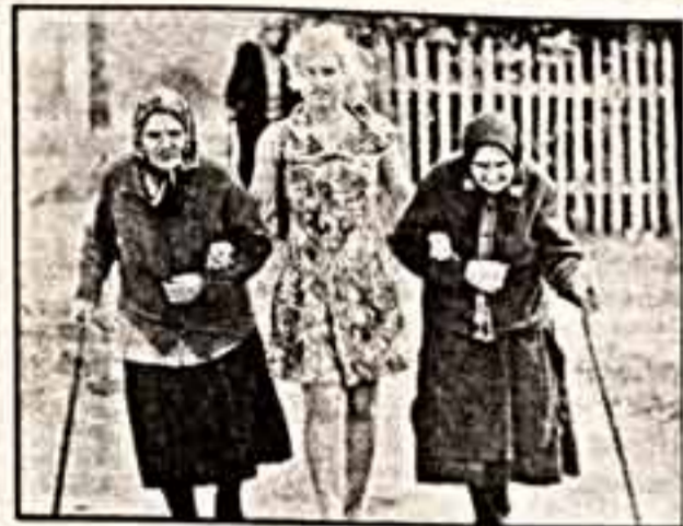
Две вторые премии присуждены — Александру Климонову за снимок «Нучка» и Ляле Кузнецовой за снимок из серии «Збор».