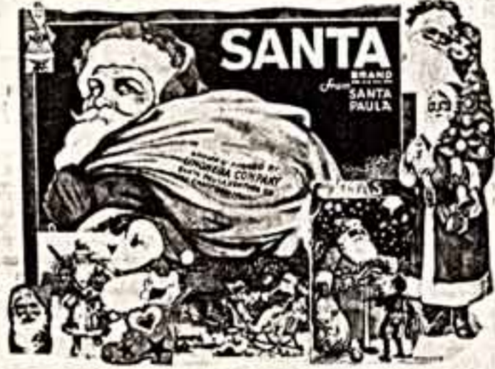
Коллажи из журнала «Иллюстрирад Лондон Ньюс» (Великобритания).