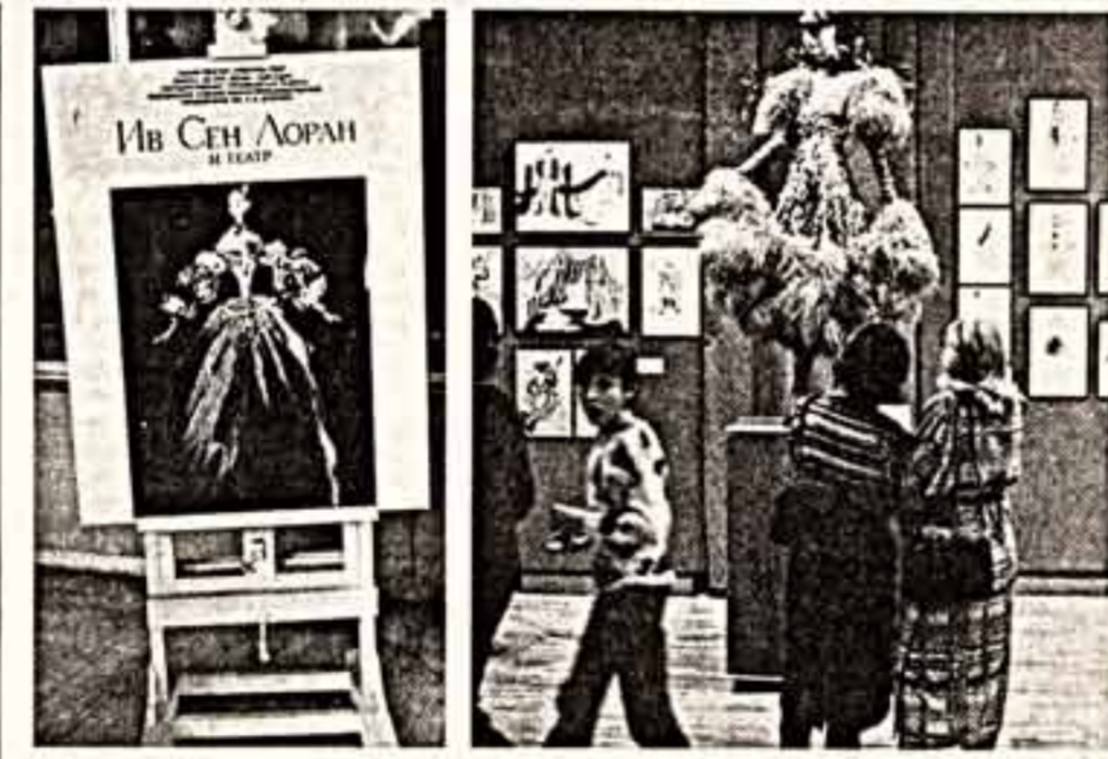
Имь одного из талантливейших современных модельеров Ив Сен Лоран хорошо известно во всем мире и у нас в стране.

Мы не заболели разнообразием и качеством телевизионных передач о театре. Незабываемая «Слово» — это не просто передача, а явление.