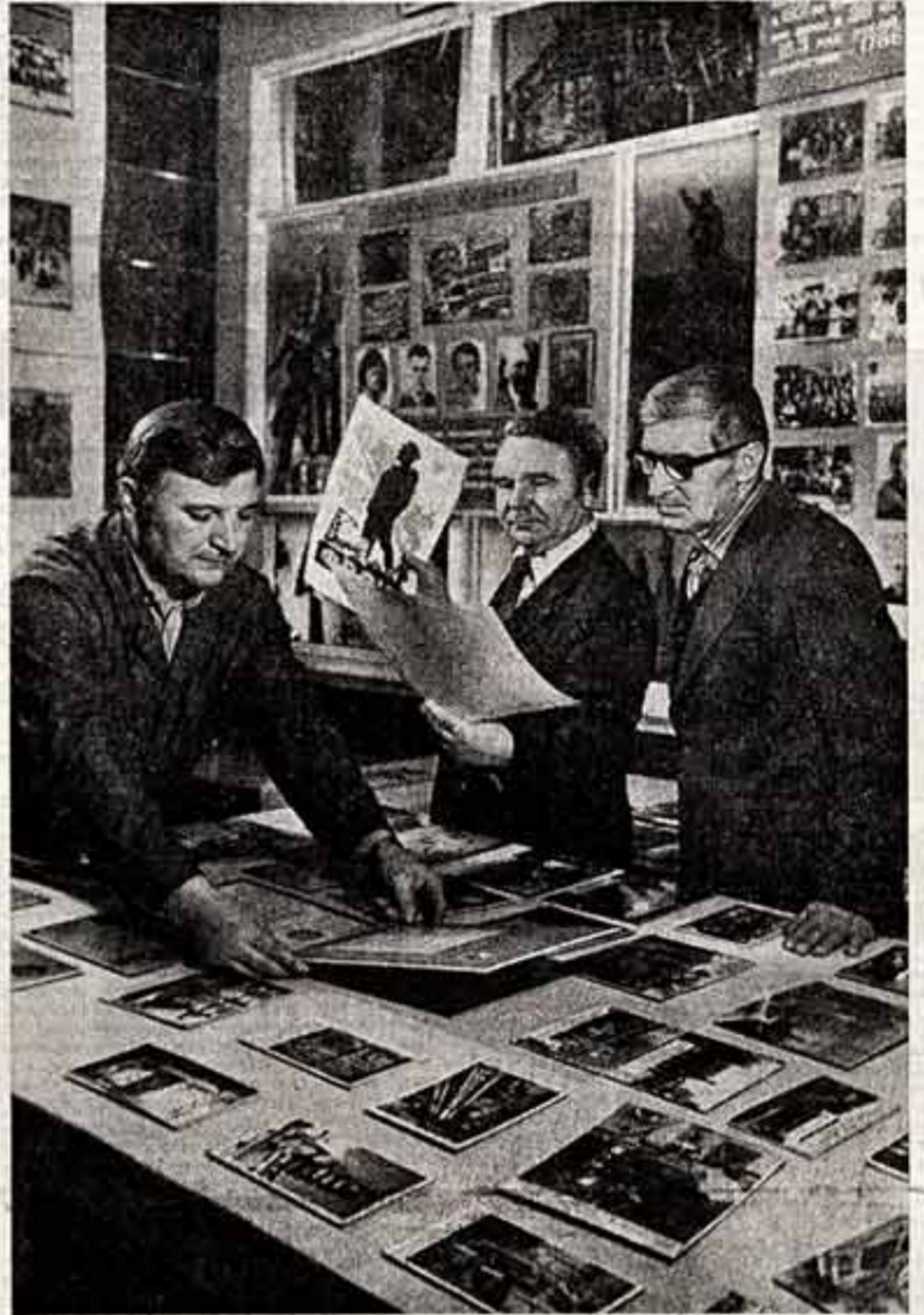
На старейшем на Украине Смяляном машиностроительном заводе (Черкасская область) готовится к открытию музей революционной, боевой и трудовой славы предприятия...

Постановление ЦК КПСС выдвигает задачи огромной важности и перед партийными и советскими органами на местах... «Хороший спектакль делает работу театра фактом огромной идеологической важности...»