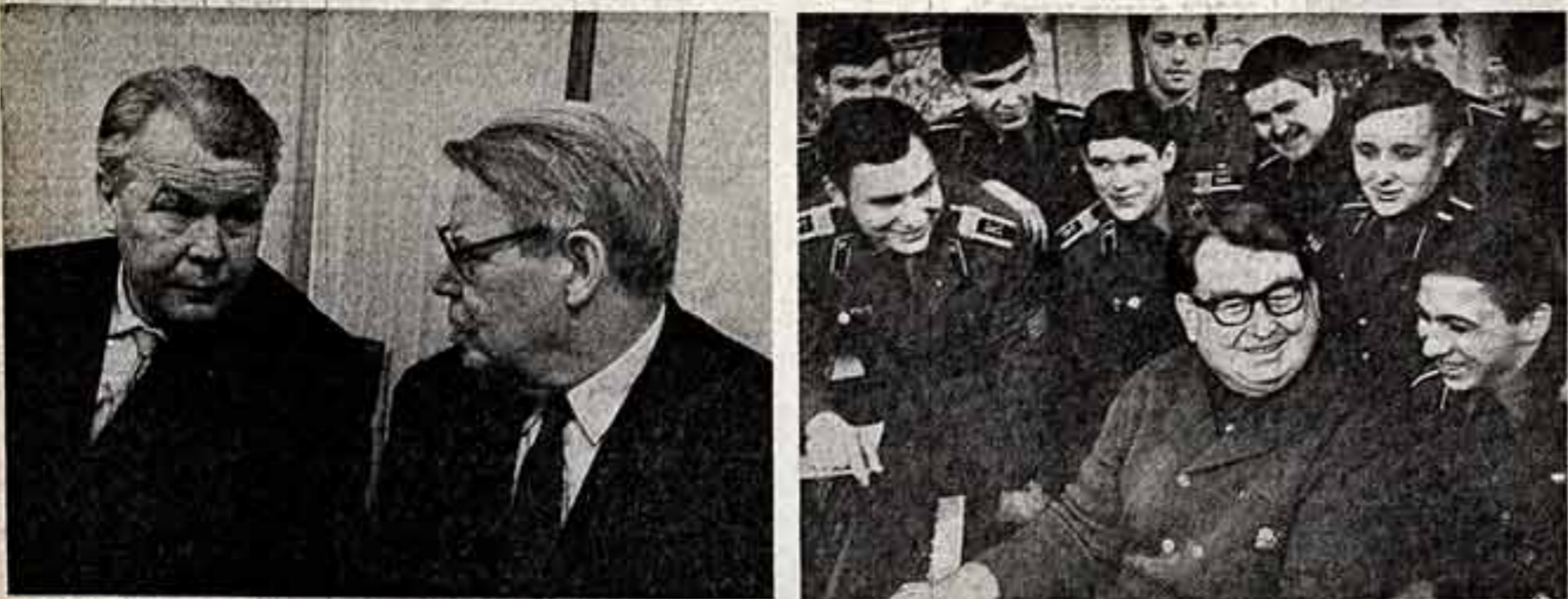
Поэты А. Твардовский и М. Исаковский. 1968 год.