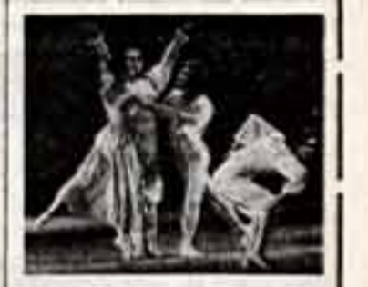
Создатели сценария Т. Путинцева и М. Бокричова...