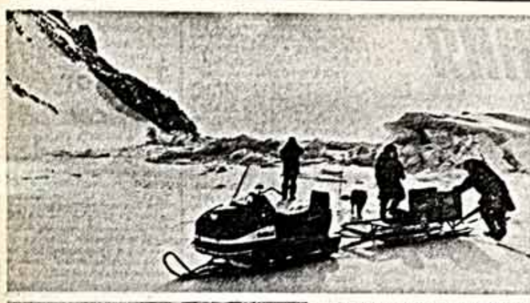
Государственный заводчик «Остров Бристоль», один из самых северных в стране, отмечает свое десятилетие. Эти снимки сделаны на небольшом острове Гералд, входящем в зону заповедника. Здесь находится царство белых медведей, уцелевшее вчетверо от обитателей острова, наблюдаются и чудотворные косяки этих интересных зверей.