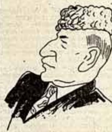
Поэт-драматург Сулейман Рустам. Рис. НАДЖАФ КУЛИ.