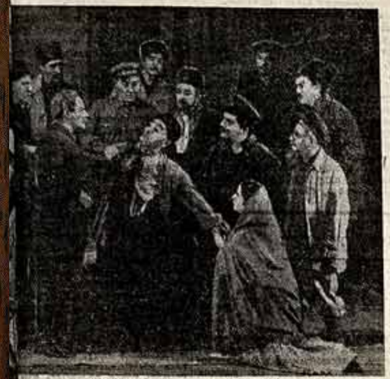
Сцена из спектакля «Бухта Ильича».