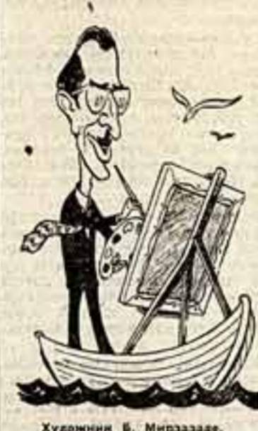
Художник В. Мирзазаде. Рис. Гр. ОГАНОВА.