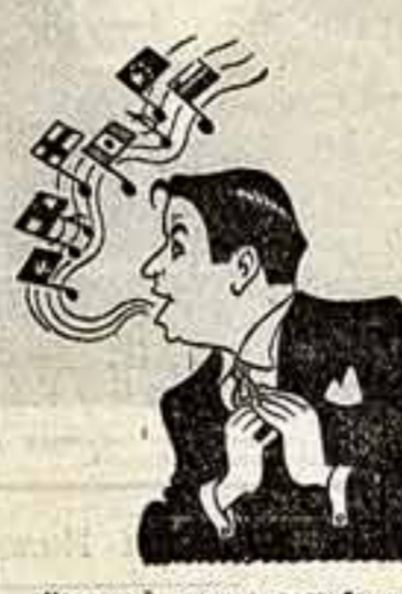
Народный артист республики Рашид Вейбутов. Рис. Гр. ОГАНОВА.