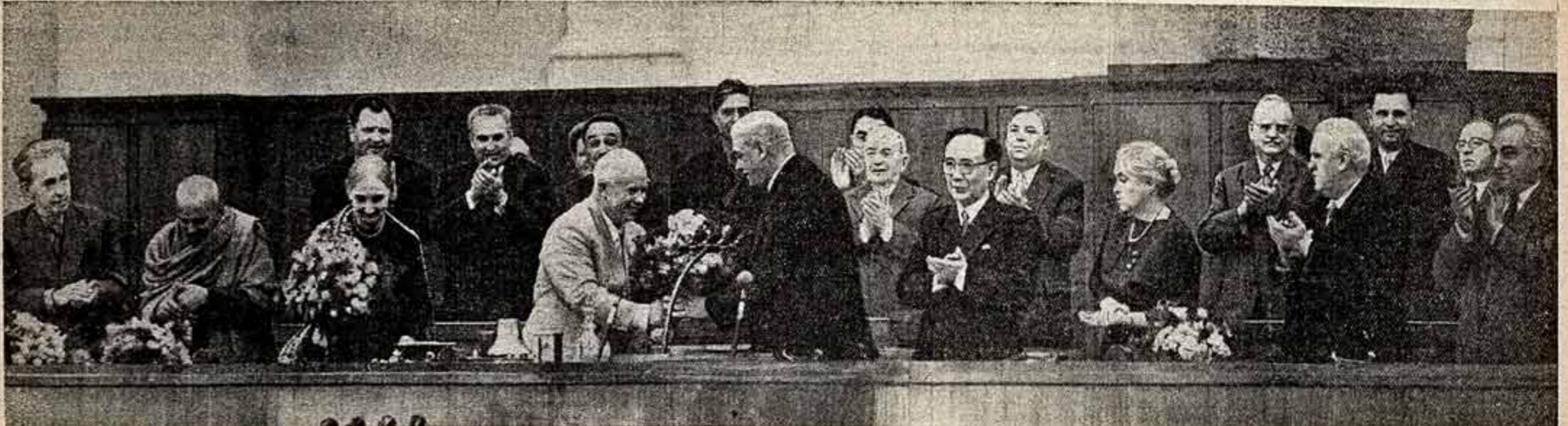
МОСКВА, КРЕМЛЬ, 16 мая 1959 года. Вручение международной Ленинской премии выдающемуся общественному и государственному деятелю СССР Н. С. Хрущеву.