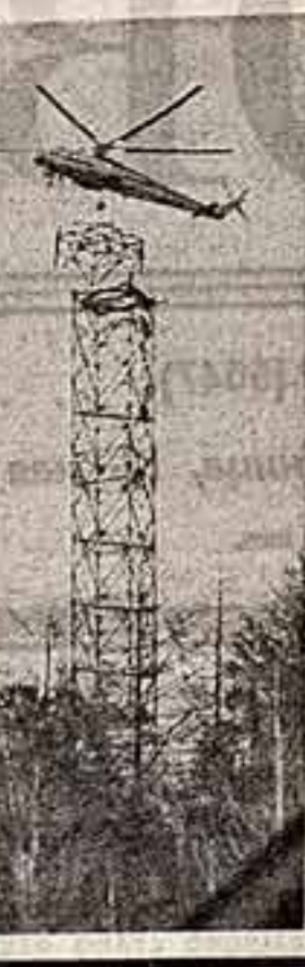
Вертолет ведет монтаж.

Д. И. Ленин высоко ценил дерзкие мечты итальянского социалиста-утописта, одна из идей которого особенно заинтересовала основателя первого в мире социалистического государства. Как вспоминал А. В. Луначарский, в январе 1918 года Владимир Ильич пригласил к себе нарком просвещения и изложил ему давнюю возлюбленную идею: «Вы помните, что Кампанелла в своем «Солнечном государстве» говорит о том, что на стенах его фантастического социалистического города нарисованы фрески, которые служат для молодежи естественным уроком по естественной истории, возбуждают гражданское чувство — словом, участвуют в деле образования, воспитания новых поколений. Мне кажется, что это далеко не лишнее и с известным изменением могло бы быть ныне усвоено и осуществлено теперь... Я называю бы то, о чем я думаю, монументальной пропагандой».