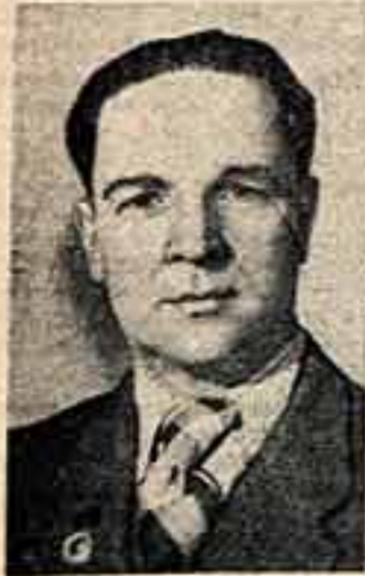
Ф. П. Решетников. Премия присуждена за картину «За мир».