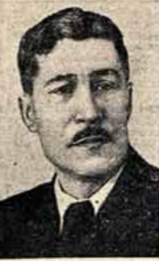
С. А. Чуйков, народный художник Киргизской ССР. Премия присуждена за картину «Взятие крепости Таш-Шаха» и «Юно в олимпийском».