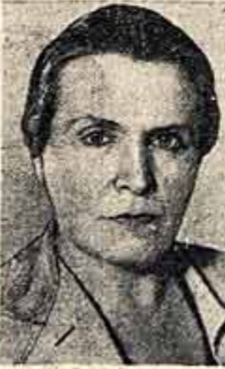
В. И. Мухина, народный художник СССР. Премия присуждена за скульптурную группу «Третье море».