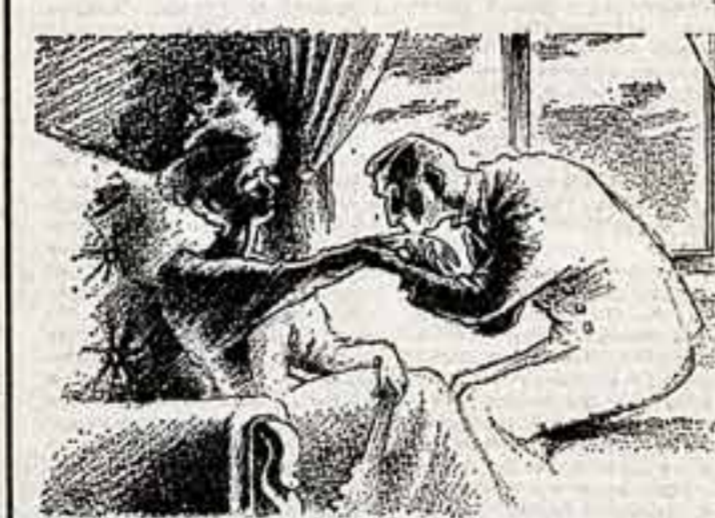
ДИЗАЙН — НА СЛУЖБУ ЧЕЛОВЕКУ