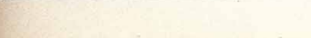
Коллектив учащихся Государственного балетного училища из Берлина — участники Дней культуры ГДР.

М. МОРДИНОВ , заслуженный деятель искусств РСФСР, профессор.