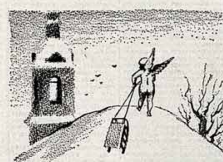
ДИЗАЙН — НА СЛУЖБУ ЧЕЛОВЕКУ