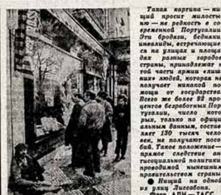
Такая картина — ищный просит милостыню — не редкость в современных Португалии. Эти бродяги бедняки, ищущие, встречающиеся на улицах и площадях разных городов страны...

важная задача — защитить революционные завоевания, в том числе в области культуры.