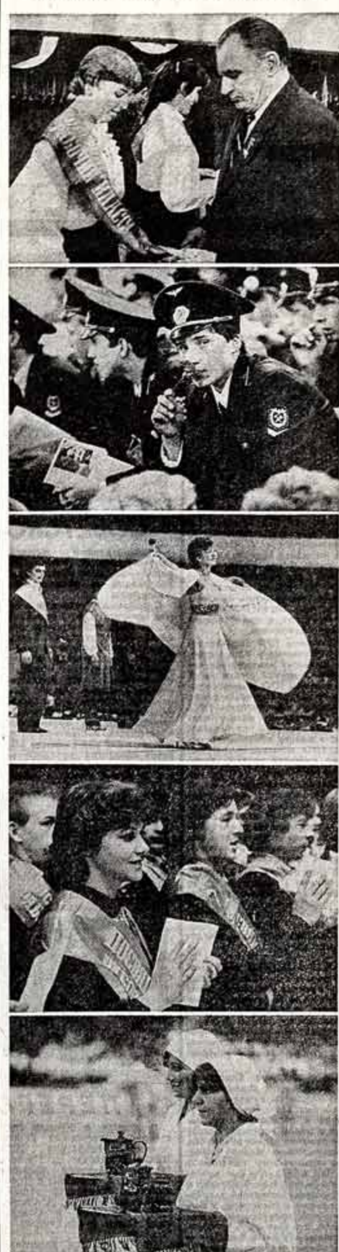
В Ленинграде, в спортивно-концертном комплексе имени В. И. Ленина, прошел XIV традиционный праздник молодых первобойцов промышленности и отличников учебы профессионально-технических училищ города и области — «День молодого рабочего». Перед молодежью выступили ветераны войны и труда, первобойцы промышленности, артисты. Стояло лето, посещение в рабочей спецовке.