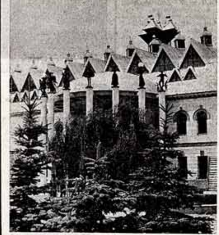
Здание Театра юной аудитории.