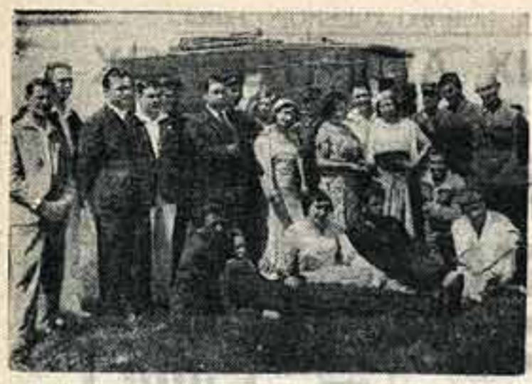
Бригада ГАБТ в Забайкалье

Заключается гастроли Московского театра революции в Магнитогорске. Работе Магнитки увидели шесть лучших постановок театра.