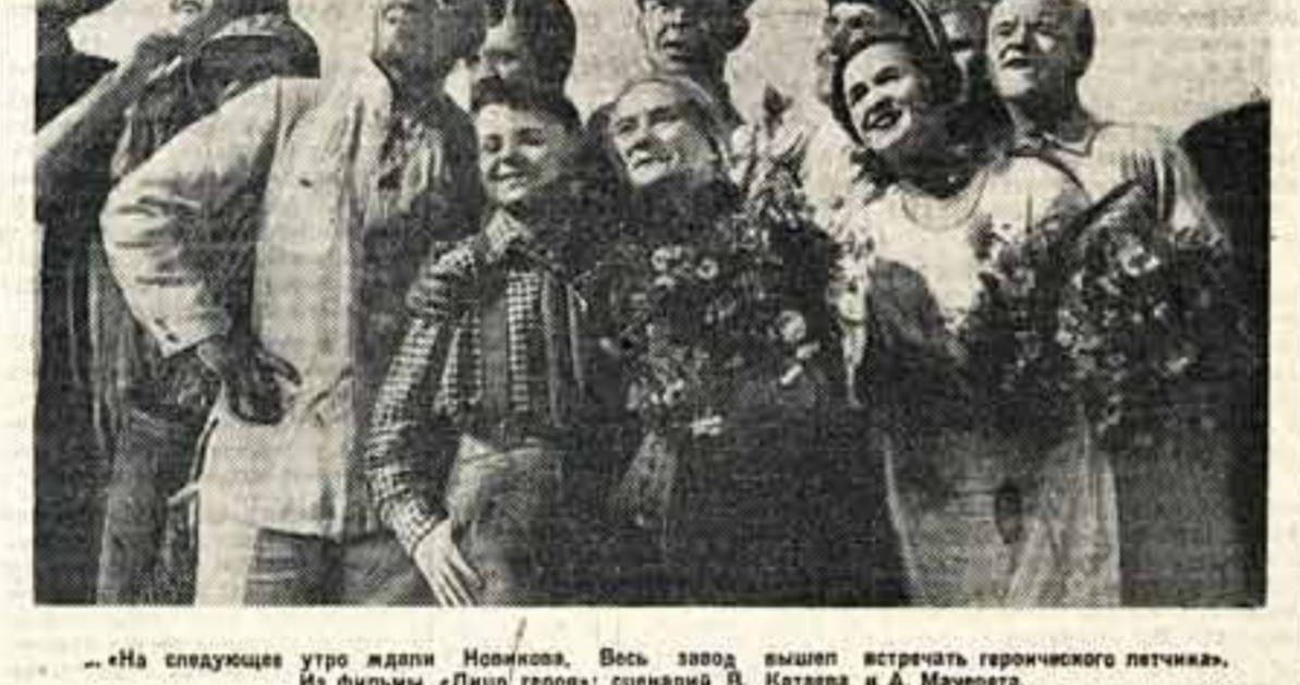
«На следующее утро ждали Новикова...»