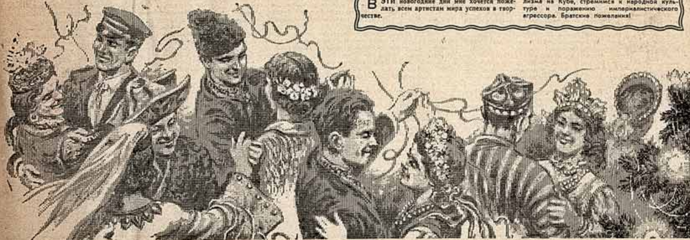
Рисунок художника Арсения ШУЛЬЦА.