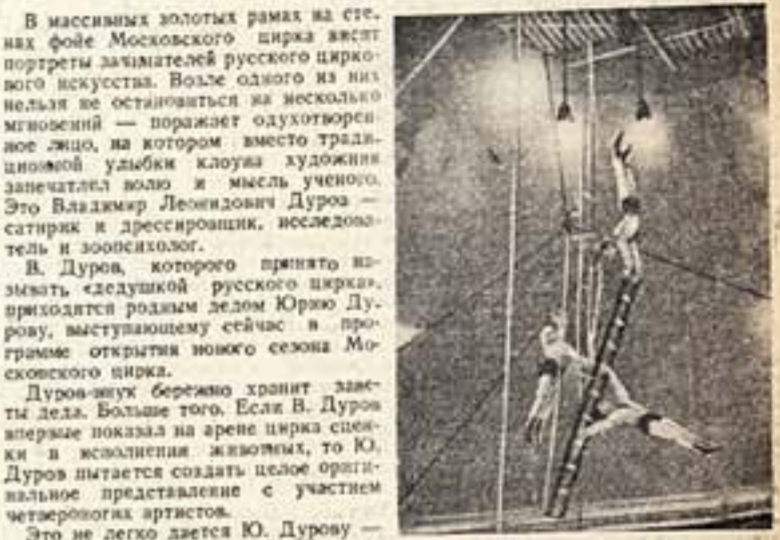
Воздушные гимнасты Мирозова.