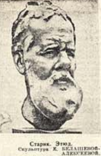
Старик Эдос. Скульптура К. БЕЛАНКОВИЧ-АЛЕКСЕЕВИЧ. Выставка работ четырех скульпторов (Москва).