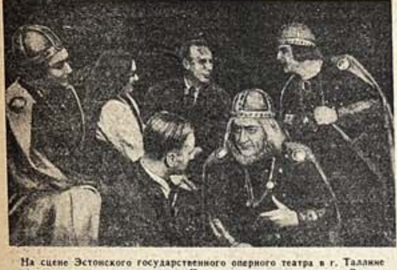
На сцене Эстонского государственного оперного театра в г. Таллине идет первая эстонская опера «Панна мещеряков» композитора Эугена Каппа...