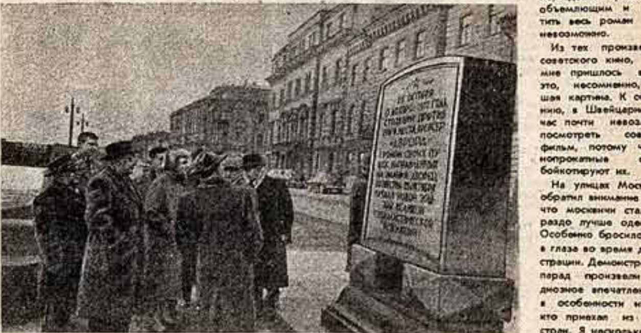
Пребывание в Ленинграде членов партийно-правительственных делегаций и делегаций дружественных и рабочих партий зарубежных стран, прибывших в СССР на празднование 40-й годовщины Великой Октябрьской социалистической революции. На сцене: члены французской делегации и исторического общества на набережной Невы против места, где в октябре 1917 года стоял крейсер «Аврора».

На улицах Москвы я обратил внимание на то, что москвичи стали гораздо лучше одеваться. Особенно бросилось это в глаза во время демонстрации. Демонстрация и парад произвели громадное впечатление — в особенности на тех, кто пришел из малых стран. Я несколько раз видел парады на Красной площади, но в этот раз парад показался мне особенно интересным.