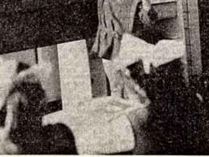
Игра в слова.

Дети в ходе нашего обучения начинают различать слова по их звуковой структуре, по тому, из каких гласных и согласных звуков они состоят. Именно этот момент и показан