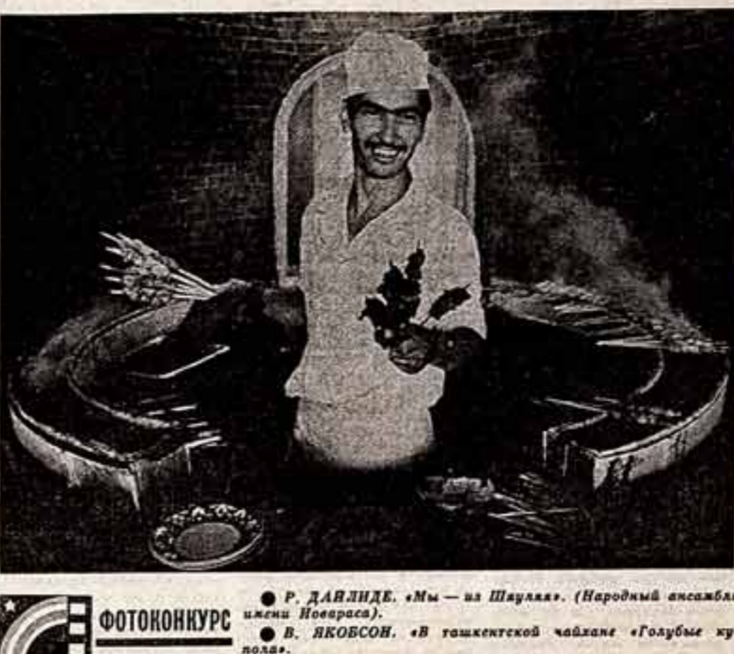
Р. ДАВИДЕ. «Мы — из Шаула». (Народный ансамбль имени Новараса). В. ЯКОВСОН. «В тагикетской чайхане «Голубые купола».