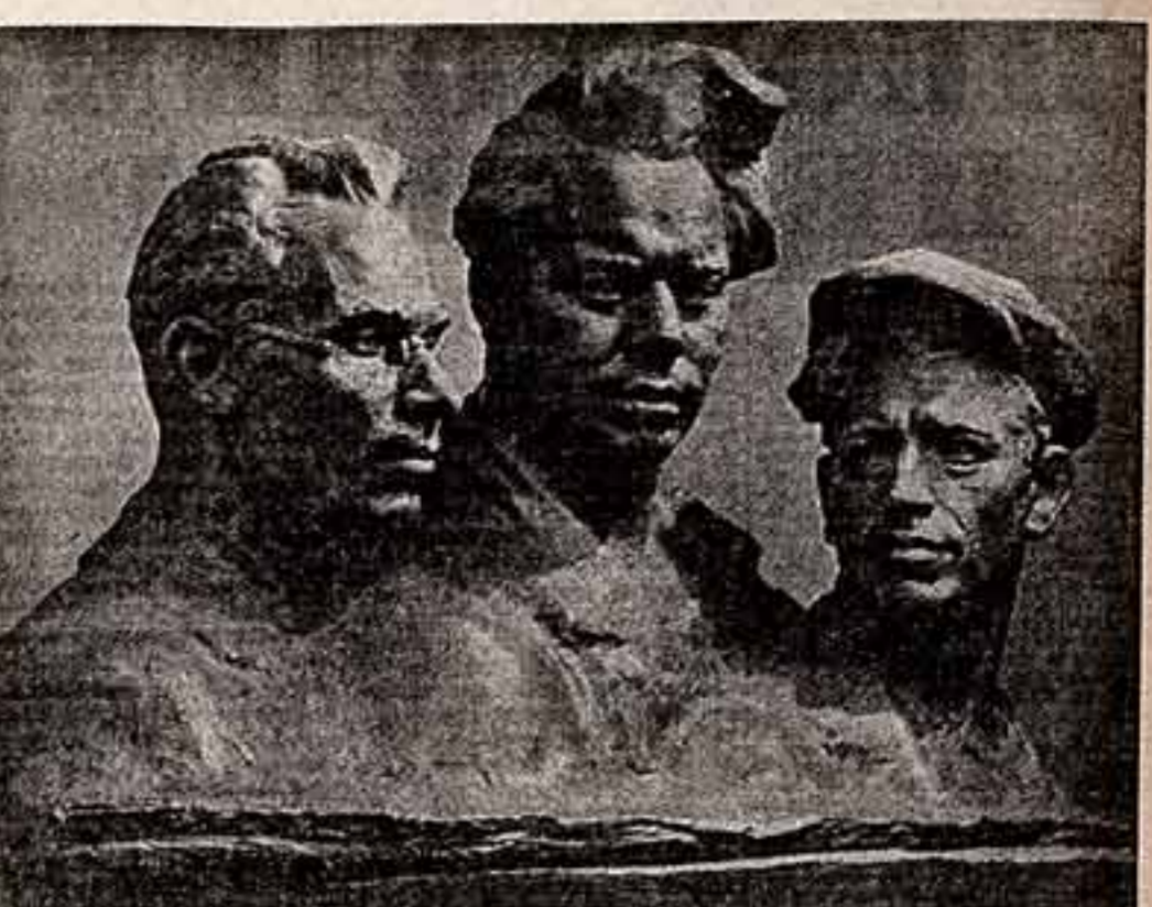
Мастерской зачастую служил фабричный цех и молочная ферма...