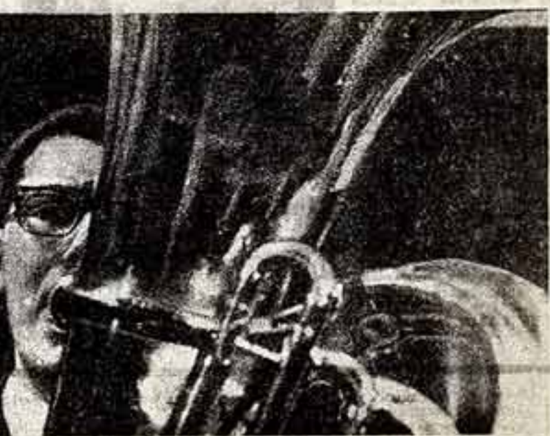
● В. Лукаш. «Туба — инструмент солиризации».