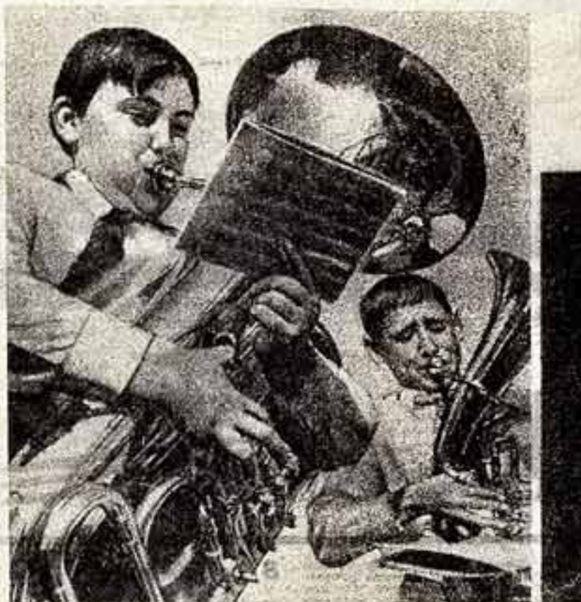
Эти работы с отчетной выставки лектория по фоторепортажу при Центральном доме журналиста. Их авторы — выпускники 1970 года. Итак, в полку зорких и находчивых, смелых и дерзующих пополнение. И, судя по масштабам выставки, пополнение талантливое, интересное.

Писатели и современники говорят об огромном опыте нашей литературы в разработке военно-патриотической темы. За 25 лет, прошедших после окончания Отечественной войны, появилось много хороших книг, посвященных героическим подвигам Великой Победы. Но теперь нужны романы, повести, стихи и поэмы о сегодняшних солдатах, это мужество, духовная и моральная стойкость. Создать новые книги о человеке в шлеме — солдате и полководце новых дней — в этом видит почетную задачу и высокий долг советского писателя.