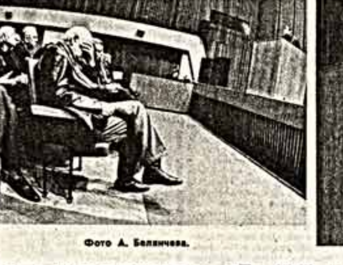
Владимир БОРТКО: Меня раздражает выражение: «творческий союз»...