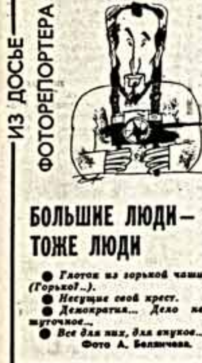
ИЗ ДОСЬЕ ФОТОРЕПОРТЕРА БОЛЬШЕ ЛЮДИ — ТОЖЕ ЛЮДИ ● Глобус из горькой чашки (Горький)... ● Истории свой крест... ● Демократия... Дело не шутное... ● Все для них, для елук...

дать на все интеллектуальную собственность. Офицером — гордое чувство защитников Отечества. Верующему — храм. Народом — их культуру, традиции, историческую память. Движение не претендует на идеологическое монополия и своих участников, но роль государства, на роль перепарти. Оно является деловым сотрудничеством самостоятельных и разных сил, партий и объединений граждан, приверженных реформам, отвер-