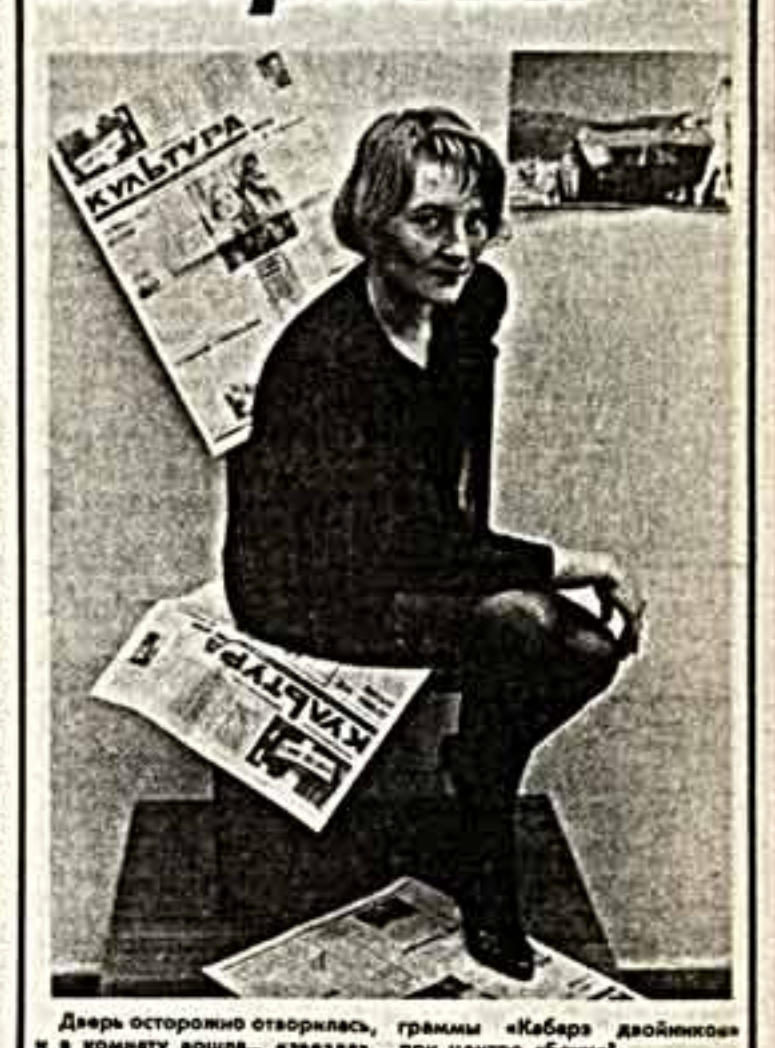
Дверь осторожно отворилась, и в комнату вошла... «звезда».