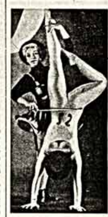
Клоунада из цирковой программы британской труппы «Ра-Ра-Зу».

В Британии течение представлено экспериментальной группой «Ра-Ра-Зу». По многочисленным отзывам, на ее спектакли ходят даже самые отъявленные невестники цирка. Работает труппа под лозунгом «Традиция плюс эксперимент», как постановили в свое время основатели труппы, известные австралийские цирковые Девя Спэтаски и Сюю Брозуй. Само собой разумеется, что британская погода не располагает к гастролям поездкам по брезентовым шатрам, поэтому цирки из «Ра-Ра-Зу» в отличие от своих континентальных коллег склонны девять представления в театры. И это, конечно, заставляет упреждать программу. Там же, где последние несколько лет выступала «Ра-Ра-Зу» на родине продюсер с аншлагами. Шумный успех сопутствовал гастролям труппы в европейские страны, а также в Китае, Австралии, Канаде, США. Фантастичнее, например, по задумке и исполнению, пишет «Юропан», программа труппы под названием «Гравитационные качели». В ход идут цирковые, хореографические и технические ухищрения, дабы создать иллюзию мира, в котором сила тяжести является так же капризно, как погода.