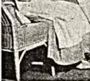
Великие князья во время войны воевали в рядах императорской армии.