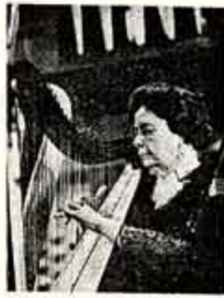
Играет народная артистка СССР Вера Дулова.

нальные актеры, — просто люди, знакомые и понимающие театр изнутри.