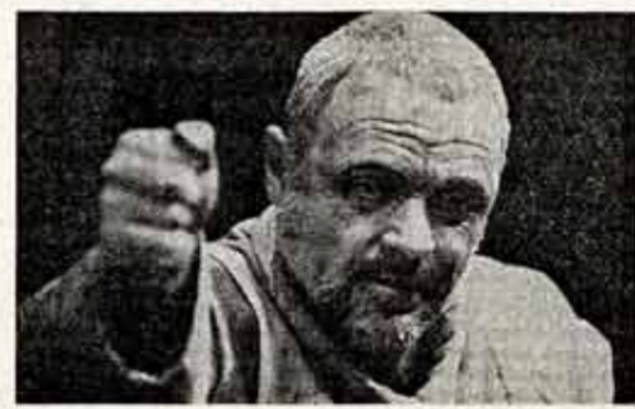
Антони Хопкинс в спектакле «Король Лир».

Традиционно важное место в репертуаре британских театров занимает произведение Чехова. Премьеру «Три сестры» в новом переводе известного английского драматурга Майкла Фрейла покажет театр «Грипачи». Среди других премьер нынешней театральной осени в Британию, вызвавших наибольший интерес как публики, так и критики, — «Генрих IV» (первая и вторая части) и «Генрих V» Шекспира в постановке труппы «Нильс Шекспир компания», играющей на сцене праславянского театра «Олд Вик». Театр «Айон Арно» показал новую постановку «Пималион» Шоу с Питером Отулом в роли профессора Хизкина».