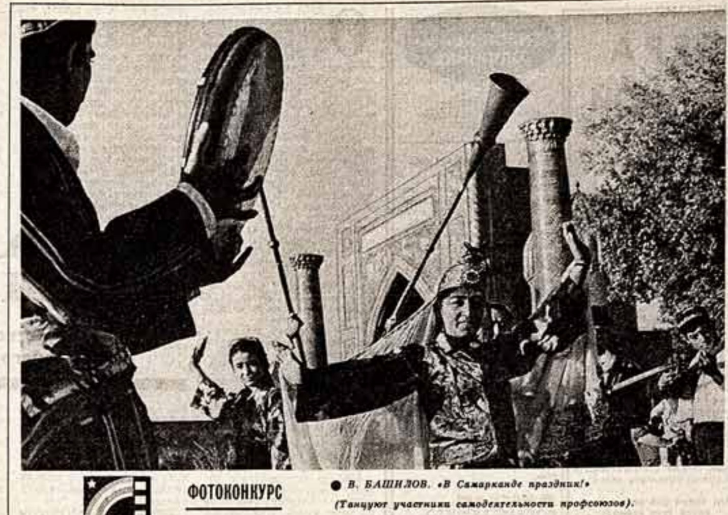
В. ВАСИЛОВ. «В Самарканде праздник» (Танцуют участники самодеятельности профсоюз).