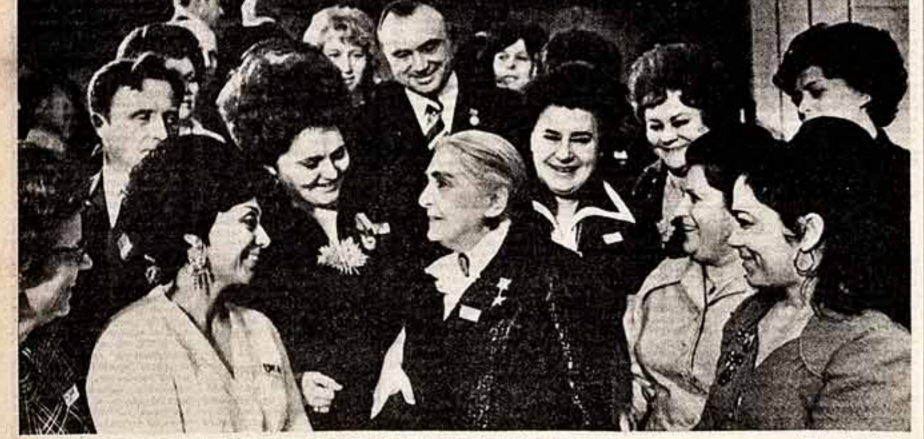
Народная артистка СССР, Герой Социалистического Труда Е. Н. Гоголева среди делегатов съезда.