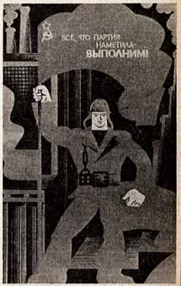
В. МАЛЫН. «Все, что партия наметила — выполним!» Издательство «Плакат».

Советские профсоюзы решительно осуждают эту кам-