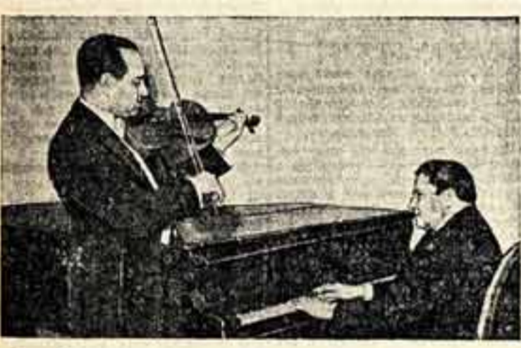
Давид Обстрах и Жорж Энеско на концерте в зале им. Чайковского.