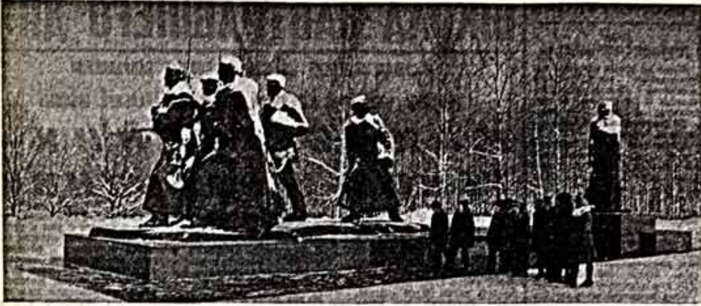
Жидане — король-турецкая, король-услыш. К уезду в Родану. Поэтесса в любви...