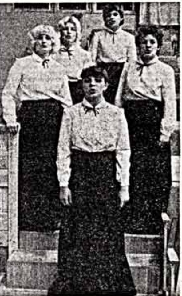
Репетирует ансамбль современного балетного танца. Вокальная группа народного хора.