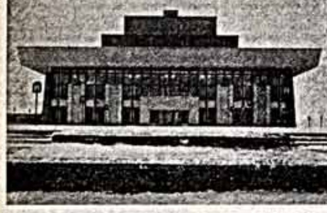
Свердловский район. Новое здание театра.

Широкие лестницы ведут в парадные фойе нового Дворца искусств. Стены его украшены декоративным мозаичным рельефом.