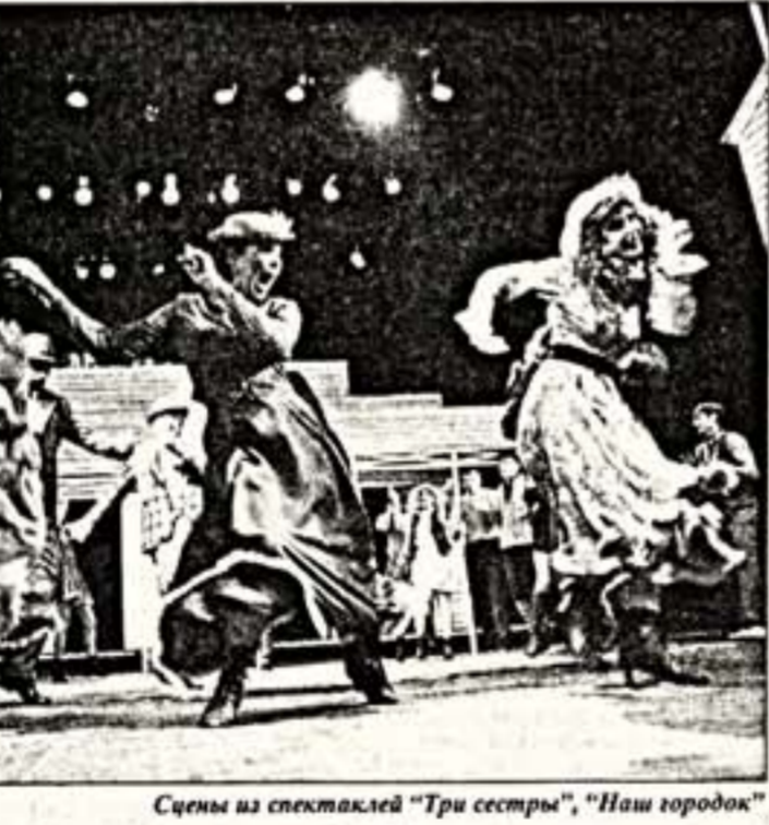
Сцена из спектаклей "Три сестры", "Наш городок"

Какие спектакли, какие глупые мелочи иногда приобретают в жизни