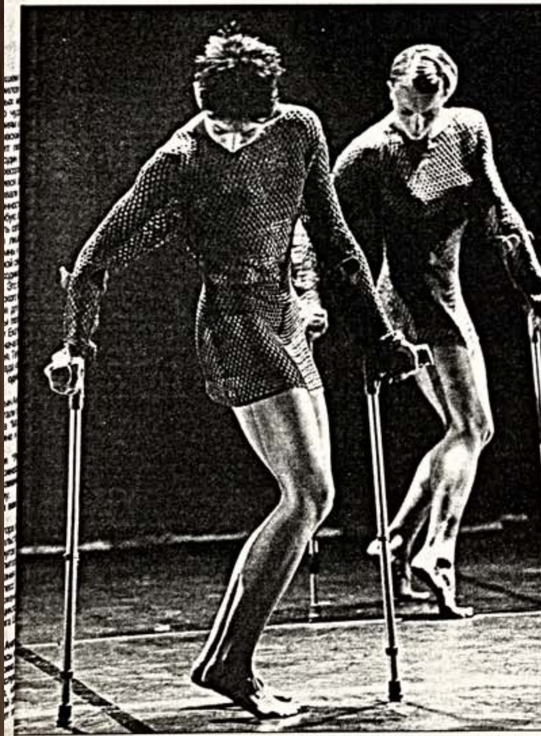
Сцена из спектакля "Никто не женится на медузах"

По сообщениям корреспондентов "Культуры" и ИТАР - ТАСС