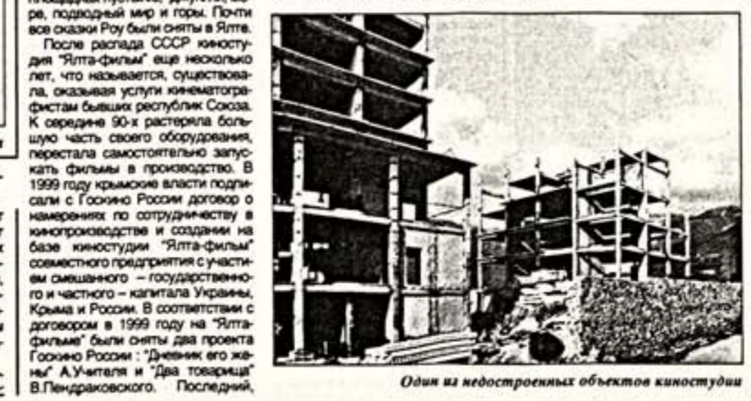
Один из недостроенных объектов киностудии