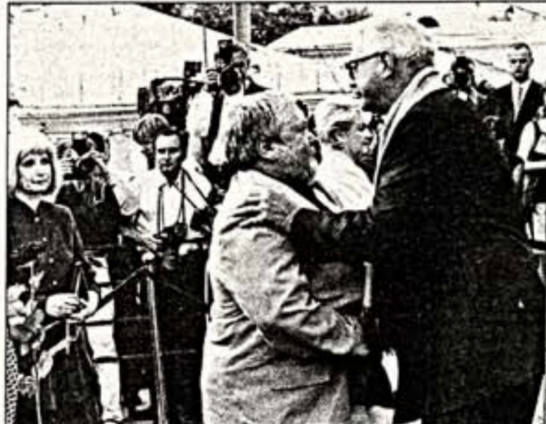
Президенты ММКФ: бывший и нынешний. С. Соловьев и Н. Михалков