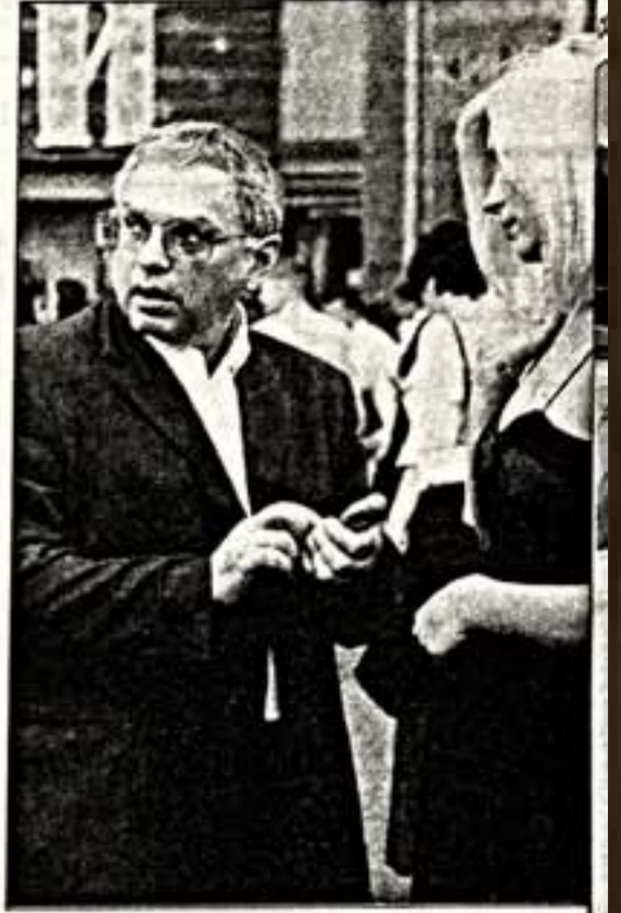
К.Шахназаров со своей прекрасной женой