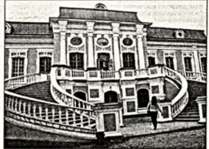
Верху: Музей-усадьба А.С.Грибоедова "Хмелит". Внизу: П.Рузвельт

Она совершенно права. Но опять-таки все упирается в отсутствие закона об особом статусе усадебных музеев, в создание соответствующих законодательных условий для возрождения "леги-