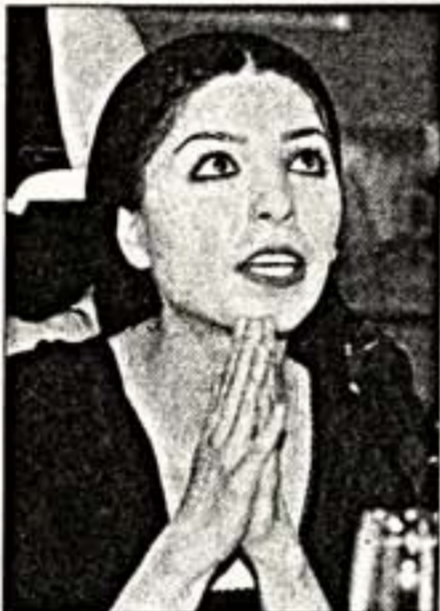
С.Мохмальбаф, дочь знаменитого отца, режиссер и член жюри